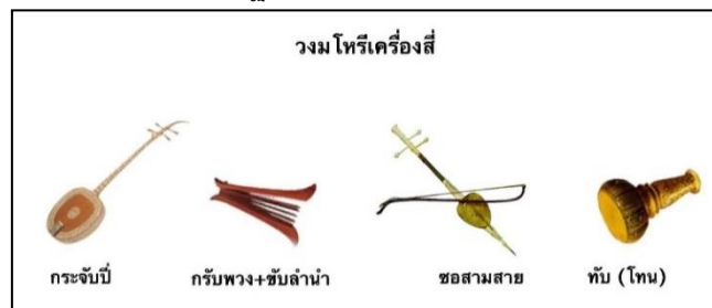
ภาพที่ ๑๔ วงมโหรีเครื่องสี่

วงมโหรีเครื่องสี่จึงประกอบด้วยเครื่องดนตรี ๔ ชิ้น ได้แก่ ขอสสามสาย ดำเนินทำนองและบรรเลงคลอไปกับร้อง กระจับปี่ เป็นเครื่องดำเนินทำนอง คนร้องและตีกรับพวง เป็นผู้ขับร้องและคุมจังหวะ ส่วนทับ(โทน) เป็นเครื่องกำกับจังหวะ สำหรับบรรเลงในพระราชฐาน เฉพาะบำเรอพระมหากษัตริย์ หรือเจ้านายชั้นสูง