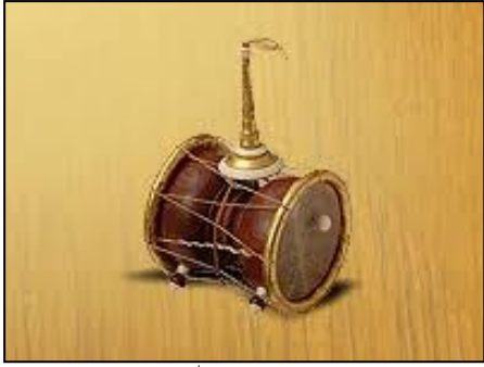
ภาพที่ ๑๑ บัณเฑาะว์