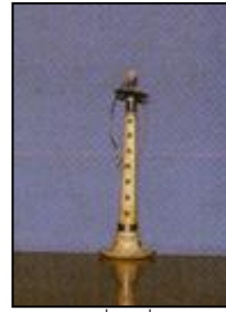
ภาพที่ ๒ ปี่ไฉน