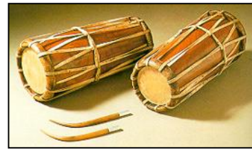
ภาพที่ ๔ กลองมลายู

..... หรือ “สรเทียด” หมายถึง กลอง สองหน้า เป็นกลองที่ซึ่งด้วยหนังทั้งสองหน้า ใช้ ไม้ตีข้างหนึ่งและมือตีข้างหนึ่ง ซึ่งน่าจะเป็น “กลองมลายู” ที่มีรูปร่างคล้ายกับกลองแขกแต่ อ้วนและสั้นกว่า