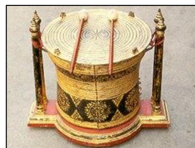
ภาพที่ ๑๐ มโหระทึก

..... สันนิษฐานว่ามีมาตั้งแต่ยุคโลหะตอนปลาย ประมาณ ๒,๐๐๐ ปีมาแล้ว บางตำราเรียกกลองมโหระทึก เพราะวิธีการบรรเลงคล้ายกลองมากกว่าฆ้อง