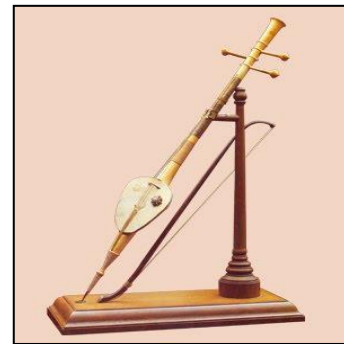
ภาพที่ ๑๒ ซอสามสาย

..... สันนิษฐานว่าเป็น ซอสามสาย เพราะมีลักษณะยาว ๆ เต้าแหลมและมีกะโหลกเป็นกระพุ้งอยู่ตรงกลาง