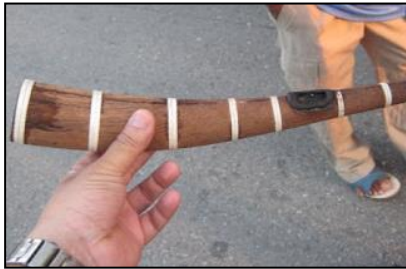
ภาพที่ ๓ สะไน (ปี่เขาควาย)

..... สันนิษฐานว่าเป็น ปี่ไฉน แต่บางตำรา กล่าวว่า ปี่สรไน คือ ปี่ใน ไม่ใช่ ปี่ไฉน นอกจากนั้นยังกล่าวอีกว่า ทางภาคเหนืออาจ เรียกชื่อเพี้ยนกลายเป็น “ปี่แน” ก็ได้