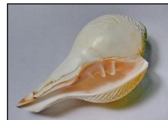
ภาพที่ ๖ แตรสังข์

..... เป็นเครื่องเป่าประเภทหนึ่ง ทำด้วยหอยสังข์สำหรับใช้เป่าอย่างแตร จึง เรียกว่า “แตรสังข์” โดยเป่าให้ดังด้วยริม ฝีปากเช่นเดียวกับการเป่าเขา