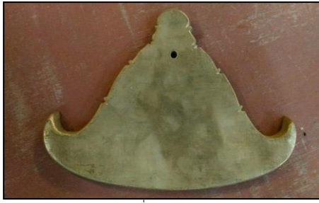
ภาพที่ ๗ กังสดาล