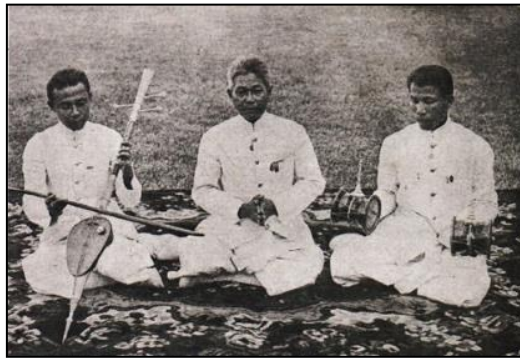
ภาพที่ ๑๓ วงขับไม้

๒. .... สันนิษฐานว่า ไทยเราคงรับระเบียบแบบแผนการขับไม้จากพราหมณ์ ซึ่งเป็นผู้นำในการประกอบพระราชพิธีต่าง ๆ ในสมัยนั้น วงขับไม้ประกอบด้วยผู้บรรเลงขอสสามสายคลอไปกับทำนองขับผู้โหวบับนเตาะว์กำกับจังหวะ และผู้ขับลำนาคลอปกับทำนองขอสสามสาย สำหรับใช้บรรเลงในพระราชพิธีสมโภช เช่น พิธีสมโภชพระมหาเศวตฉัตร พิธีสมโภชช้างเผือก พิธีเข้าลูกหลวง เป็นต้น