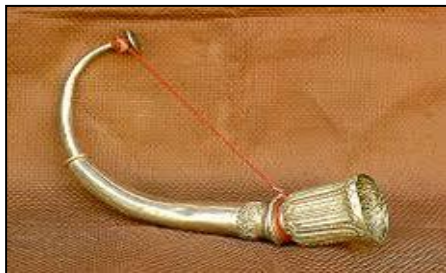
ภาพที่ ๕ กากล (แตรงอน)