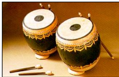
ภาพที่ ๙ กลองทัด