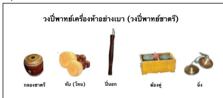
ภาพที่ ๑๕ วงปี่พาทย์เครื่องห้าอย่างเบาหรือวงปี่พาทย์ชาตรี

๔.๑ ..... สำหรับวงปี่พาทย์เครื่องห้าอย่างเบานั้น ประกอบด้วย ปี่นอก ซึ่งเป็นเครื่องดำเนินทำนองของเพลง ๑ เล้า ทับ(โทน) ๒ ใบ กลองชาตรี ๑ ใบ และฆ้องคู่ ๑ ชุด เป็นเครื่องกำกับจังหวะใช้สำหรับบรรเลงประกอบการแสดงมโนราห์หรือละคอนพื้นเมือง เช่น ละครชาตรีทางทักษิณได้แก่ มโนราห์ หนังตะลุง เป็นต้น วงปี่พาทย์ประเภทนี้จึงเรียกอีกชื่อหนึ่งว่า “วงปี่พาทย์ชาตรี”