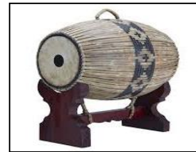
ภาพที่ ๘ ตะโพน

..... หมายถึง กลองที่ซึงด้วยหนังทั้งสองหน้า และมีสายเร่งเสียงที่ทำด้วยหนัง นั่นก็คือ ตะโพนในปัจจุบัน