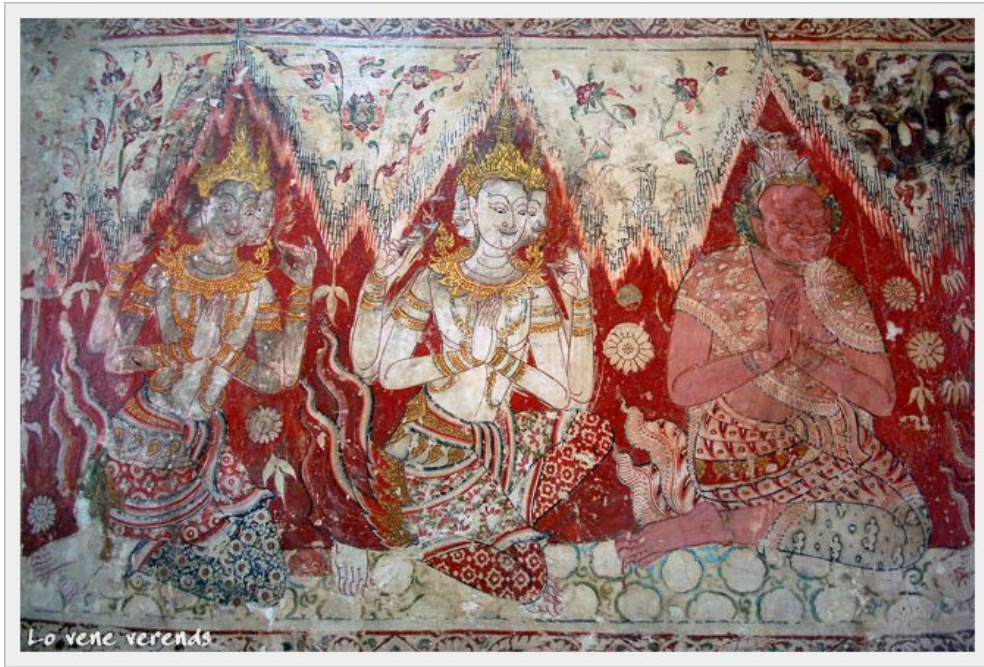
2.3 ภาพจิตรกรรมเทพชุมนุม วัดใหญ่สุวรรณาราม จ.เพชรบุรี