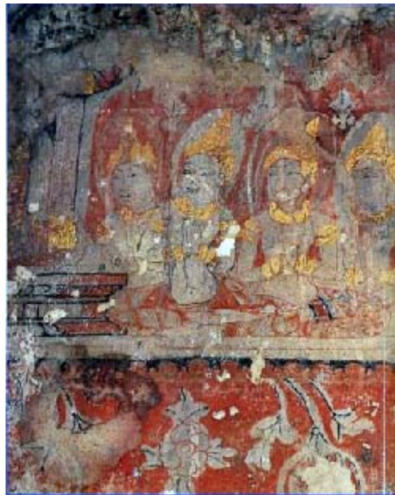
2.1 และ 2.2 ภาพจิตรกรรมฝาผนังพระโพธิสัตว์ในพระชาติต่าง ๆ ในกรุพระปรางค์ วัดราชบูรณะ