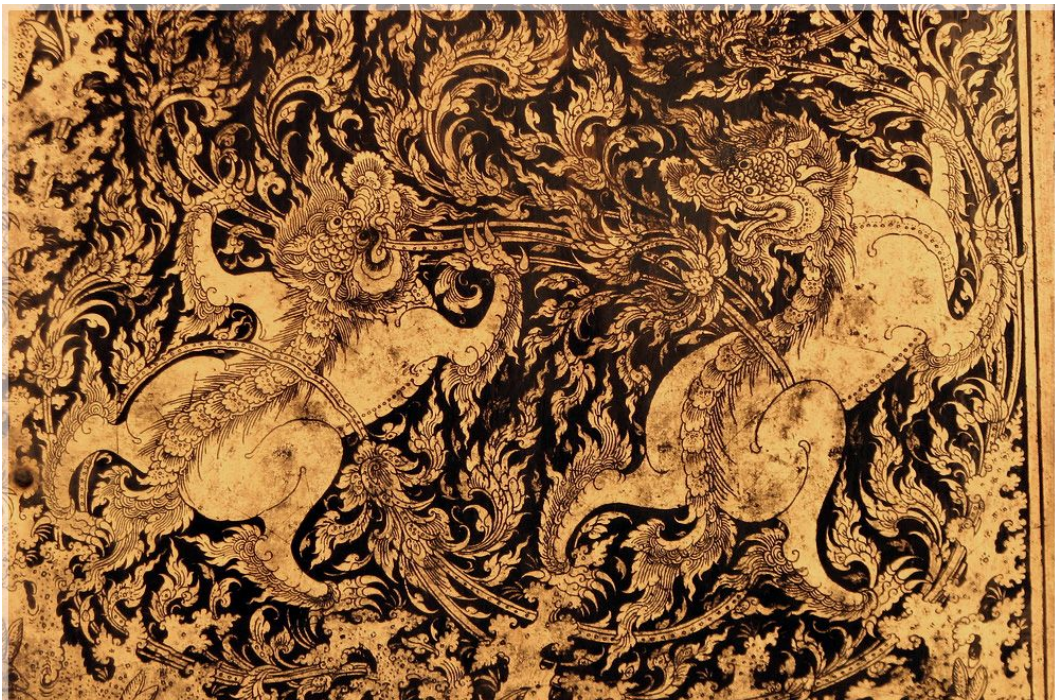
2.4 ภาพสัตว์และลายกระหนกเปลว ลายรดน้ำตู้พระธรรม วัดเชิงหวาย