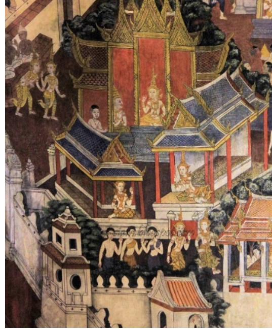
3.2 และ 3.3 ภาพจิตรกรรมพระพุทเจ้าและภาพกษัตริย์ ที่วัดพระเชตุพลวิมลมังคลาราม สมัยรัชกาลที่ 3