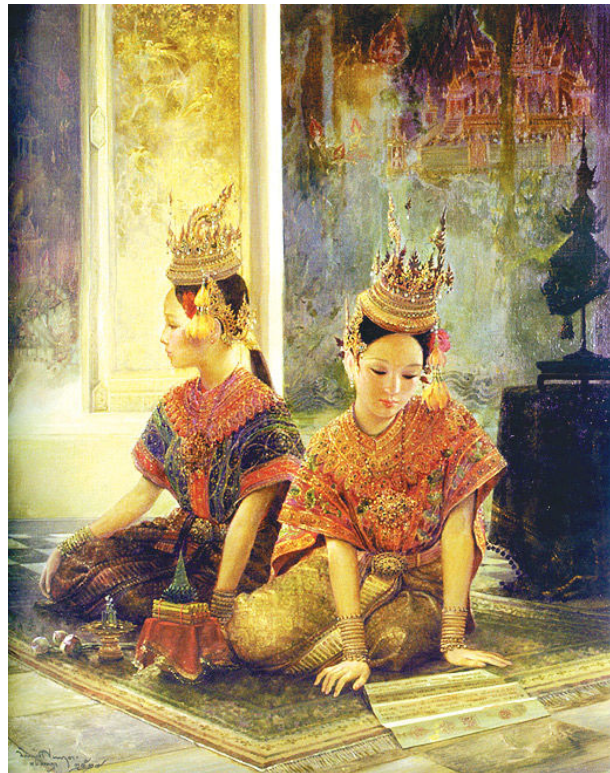
3.6 ภาพบาหยัน-ประเสหรัน โดยอ.จักรพันธ์ โปษยกฤต