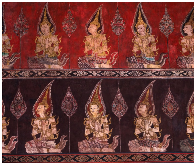
3.1 ภาพเทพชุมนุม พระที่นั่งพุทไธสวรรย์