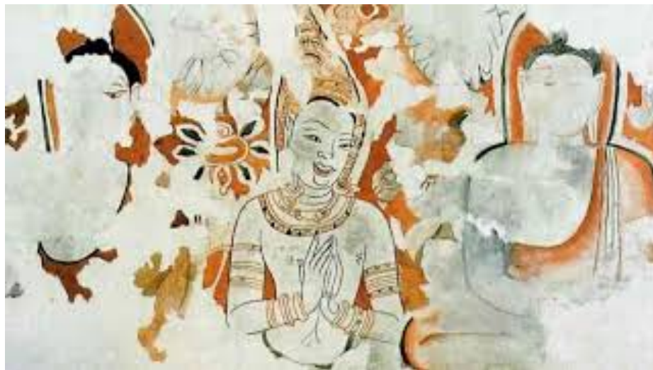
1.2 ภาพจิตรกรรมฝาผนังอดีตพระพุทธเจ้า พบที่วัดเจติยเจ็ดแถว อำเภอศรีสัชนาลัย จังหวัดสุโขทัย