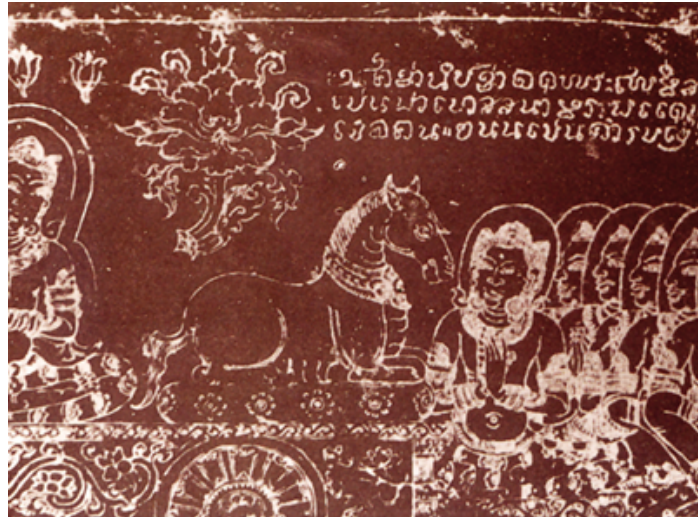
1.1 ภาพจิตรกรรมโคชานียชาดก เป็นภาพจำหลักลายเส้นบนหินชนวน ประดับผนังมณฑปวัดศรีชุม จังหวัดสุโขทัย