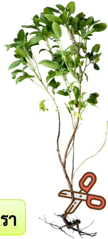
ต้นกะเพรา