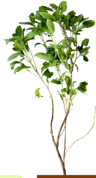
ต้นกะเพรา