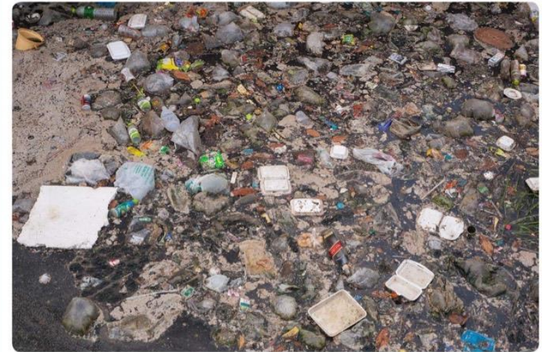
ปัญหาขยะในแม่น้ำลำคลอง

ให้นักเรียนอภิปรายและร่วมกันวิเคราะห์จากสถานการณ์ที่ครูกำหนด ได้แก่ ปัญหาขยะในแม่น้ำลำคลอง ในตัวอย่างเมื่อต้นชั่วโมง โดยการใช้คำถาม 5W1H แล้วเขียนสรุปเป็นกรอบของปัญหาเพื่อให้สามารถหาวิธีแก้ปัญหาคได้ตรงจุด