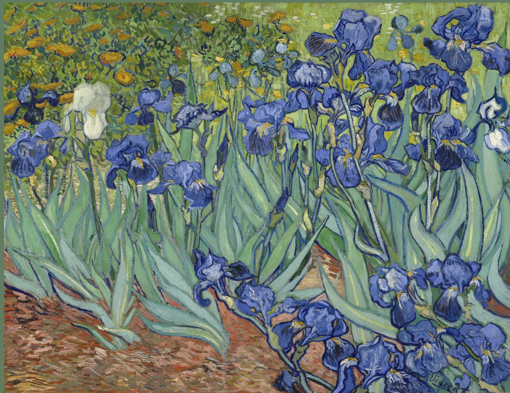
ภาพวาดดอกไอริส ผลงานของแวนโก๊ะ