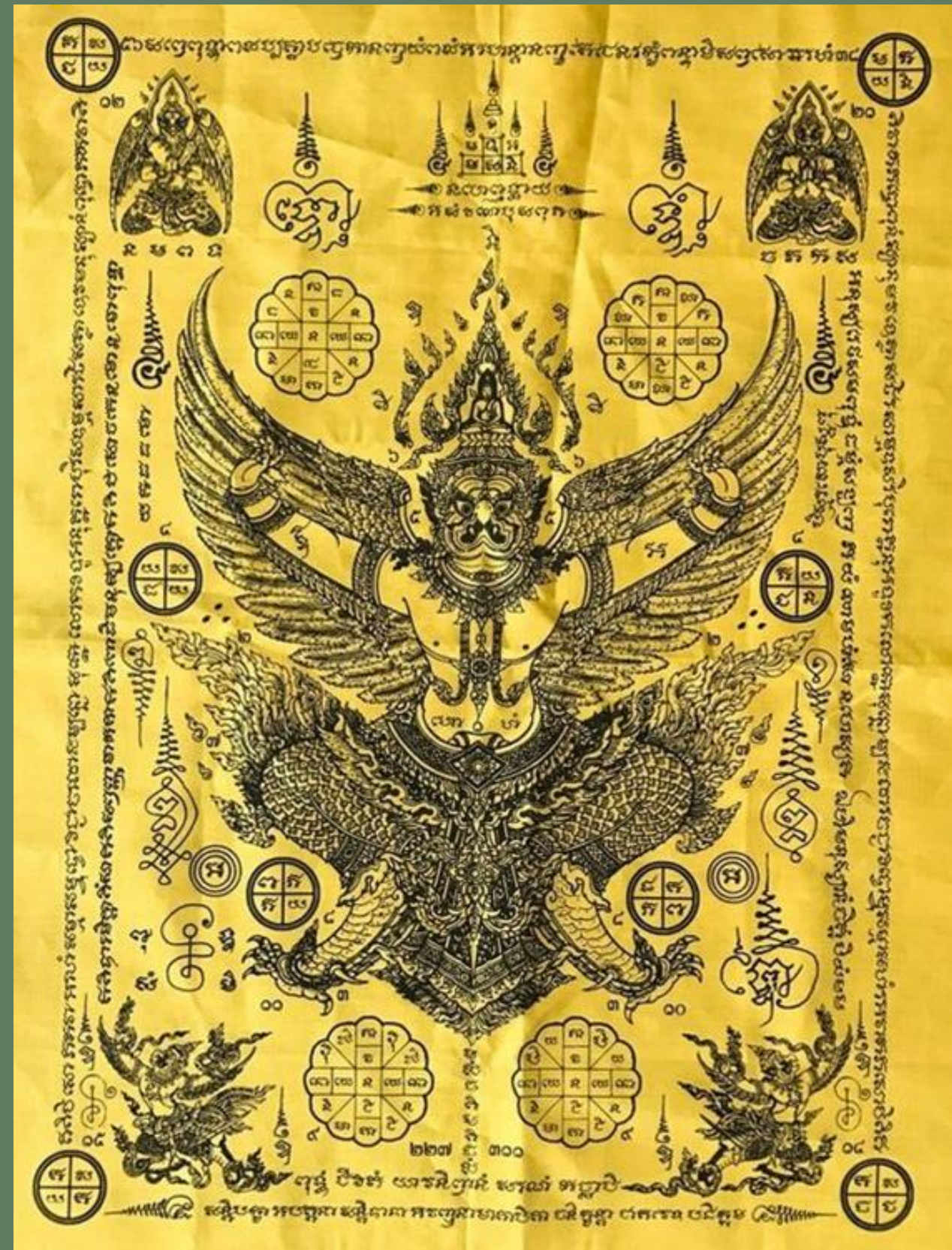
การเขียนผ้ายันต์

เป็นสิ่งเสริมสร้าง ความเชื่อมั่นทางจิตใจ