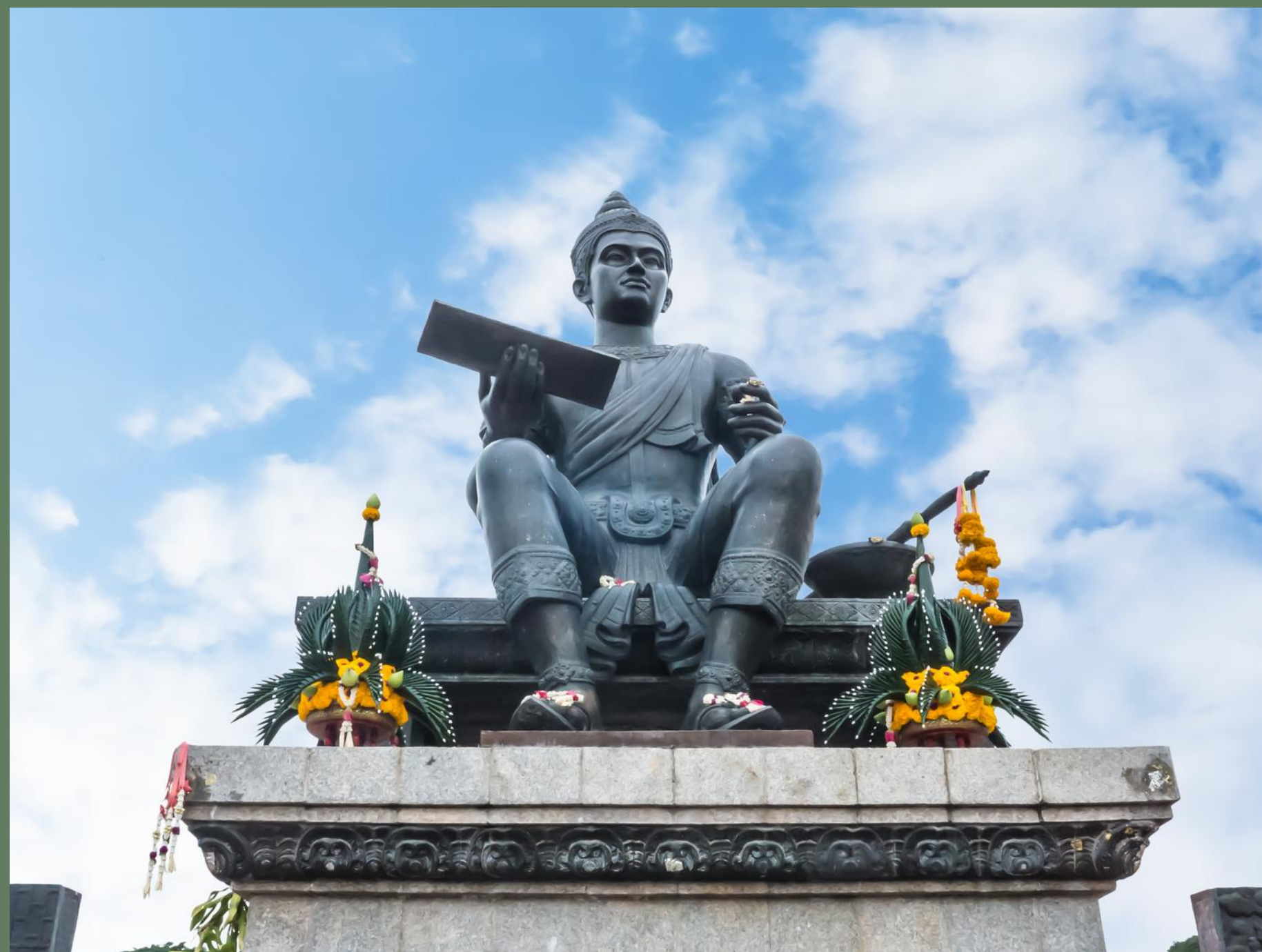
พระบรมราชานุสาวรีย์พ่อขุนรามคำแหง