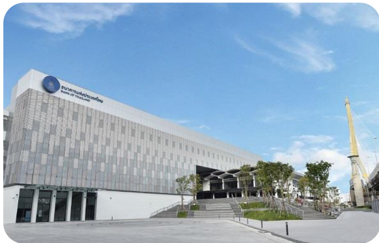
ที่มาภาพ

ธนาคารกลาง ในการควบคุม ปริมาณเงิน ดูแลทุนสำรอง ระหว่างประเทศและจัดพิมพ์ ธนบัตร