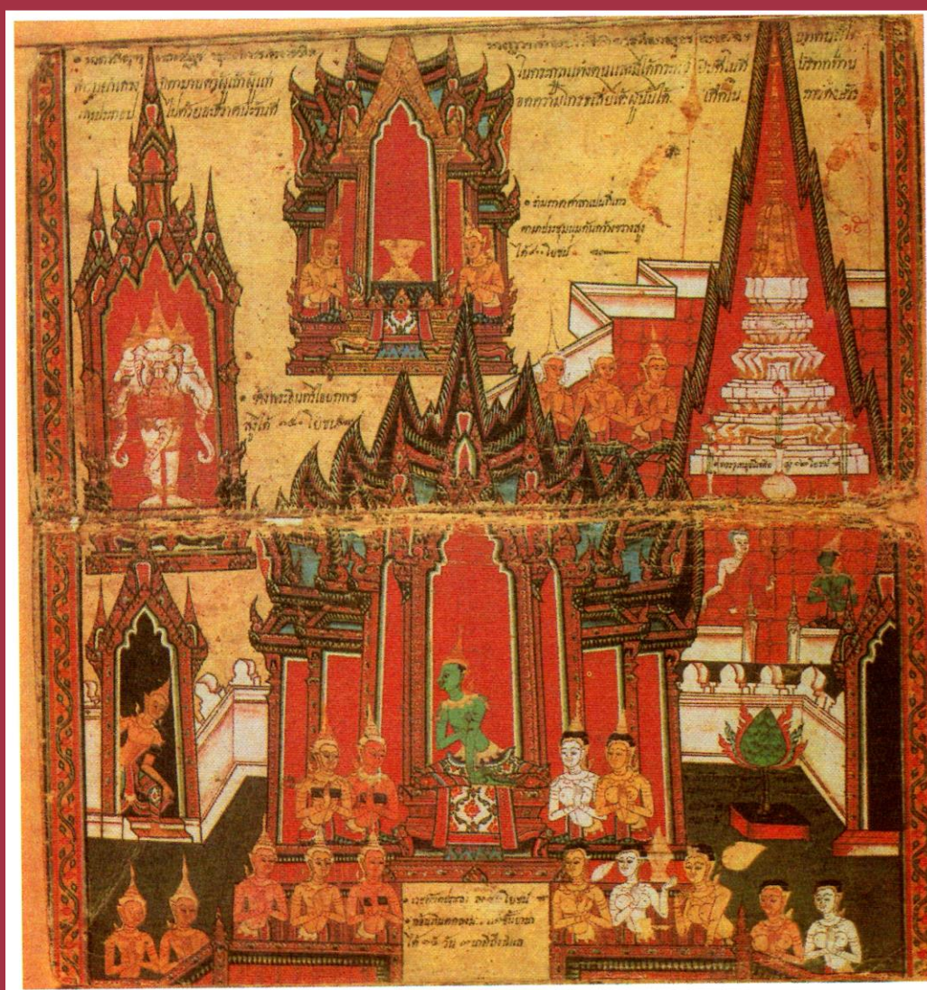
สวรรค์ชั้นดาวดึงส์

บุคคลผู้ใดคำรพยำเกรงบิดามารดาผู้เฒ่าผู้แก่ในตระกูลแห่งตน และมีได้ตระหนี่อินดีในที บริจาทาน แลประกอบไปด้วยความอดกลั้นความโกรธเสียได้ ผู้นั้นได้เกิดในดาวดึงส์สวรรค์