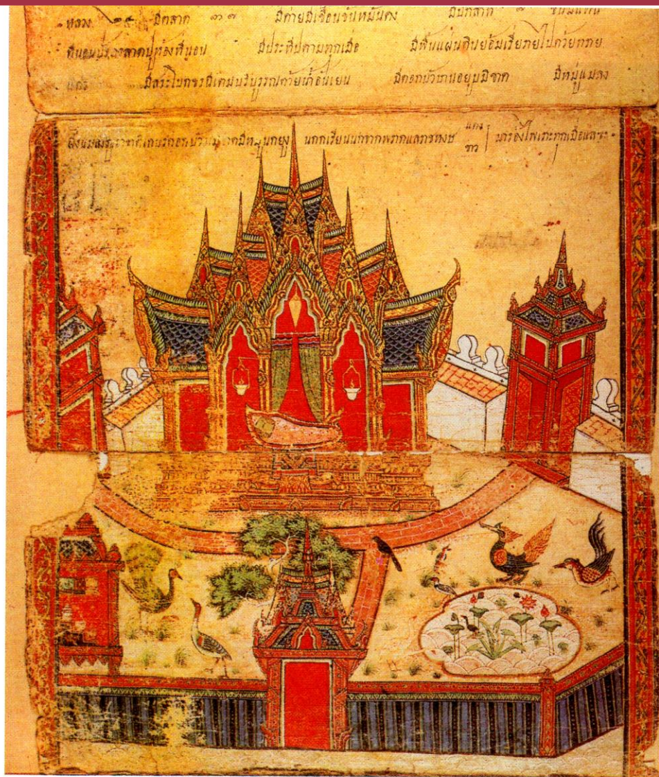
มหานครนิพพาน

มหานครนิพพาน ตามคติมหายานเรียกว่าเมืองสุขาวดี มีพื้นแผ่นดินเรียงรายด้วยทรายแก้ว สระโบกขรณี บริบูรณ์ด้วยน้ำเย็น เต็มไปด้วยดอกบัวบานอยู่มีชาติ หมู่แมลงภู่งูเคล้าเกสรบัว และหมูนกยูง นกกระเรียน นกจากพราศ และราชหงส์แดง ราชหงส์ขาว มาร้องไห้เพราะทุกเมื่อ