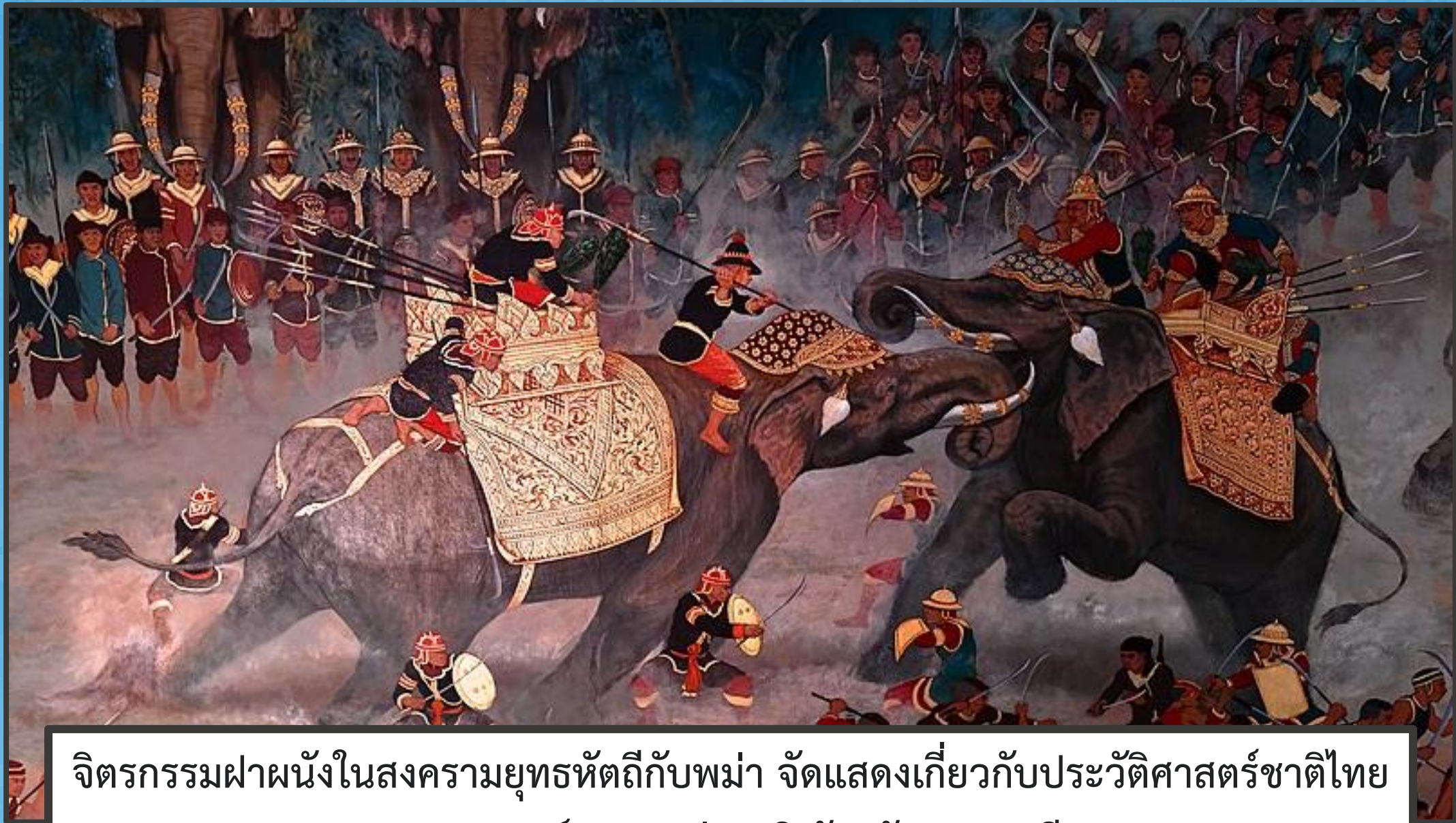
จิตรกรรมฝาผนังในสงครามยุทธหัตถีกับพม่า จัดแสดงเกี่ยวกับประวัติศาสตร์ชาติไทย ณ อนุสรณ์สถานแห่งชาติ จังหวัดปทุมธานี