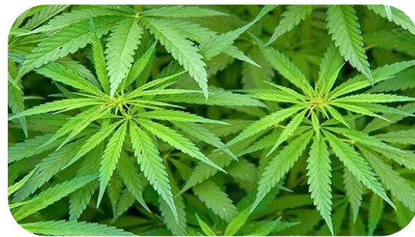
ยาเสพติดประเภทออกฤทธิ์ผสมผสาน

ได้แก่ แอลเอสดี ดีเอ็มพี และ เห็ดขี้ควาย