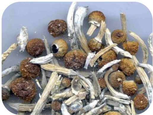
ยาเสพติดประเภทหลอนประสาท

ได้แก่ แอลเอสดี ดีเอ็มพี และ เห็ดขี้ควาย