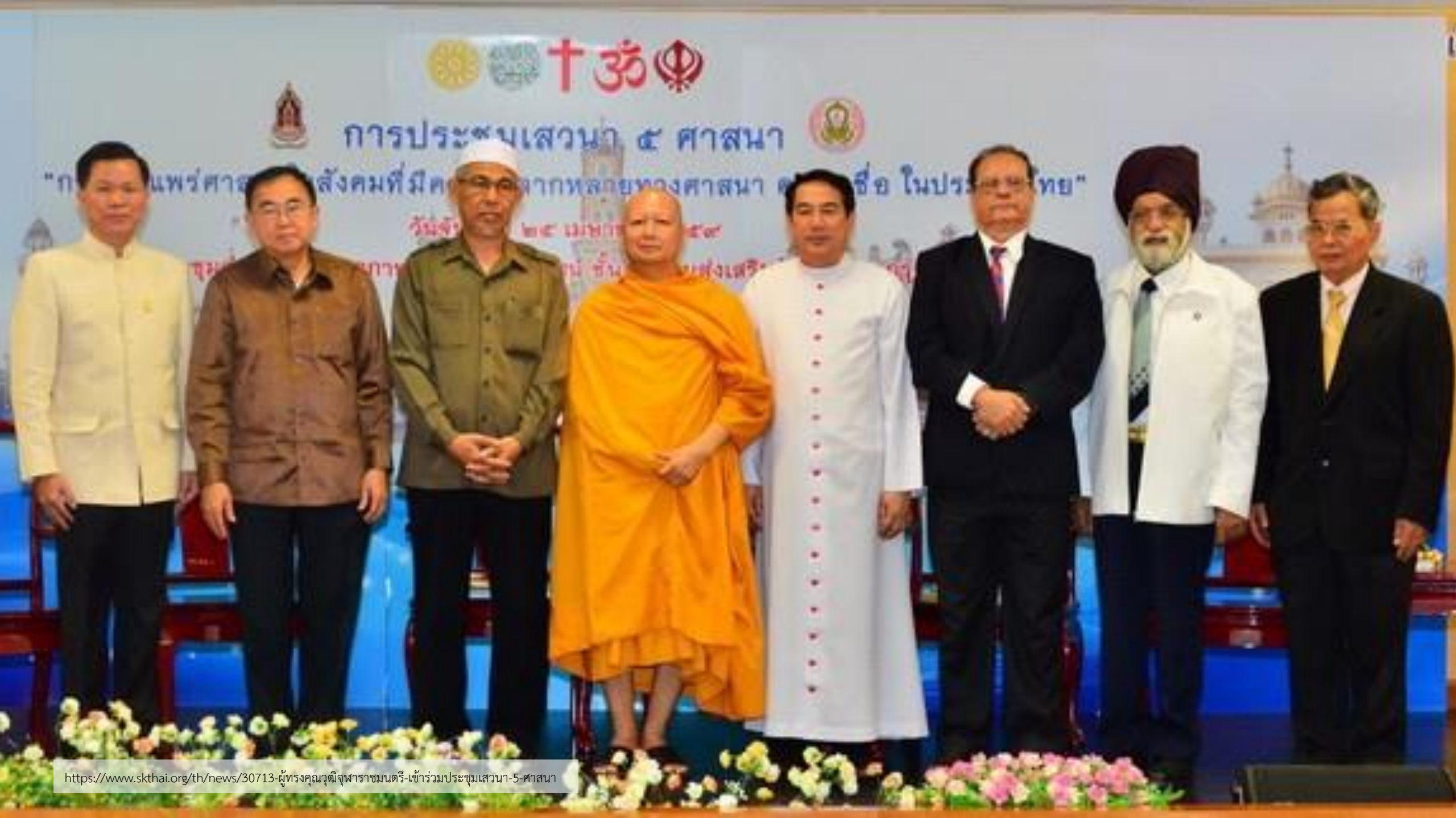
https://www.skthai.org/th/news/30713 -ผู้ทรงคุณวุฒิจุฬาราชมนตรี-เข้าร่วมประชุมเสวนา-5ศาสนา