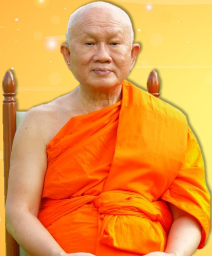
สมเด็จพระพุทธโฆษาจารย์ (ประยุทธ์ ปยุตฺโต), ศาสตราจารย์ (พิเศษ)