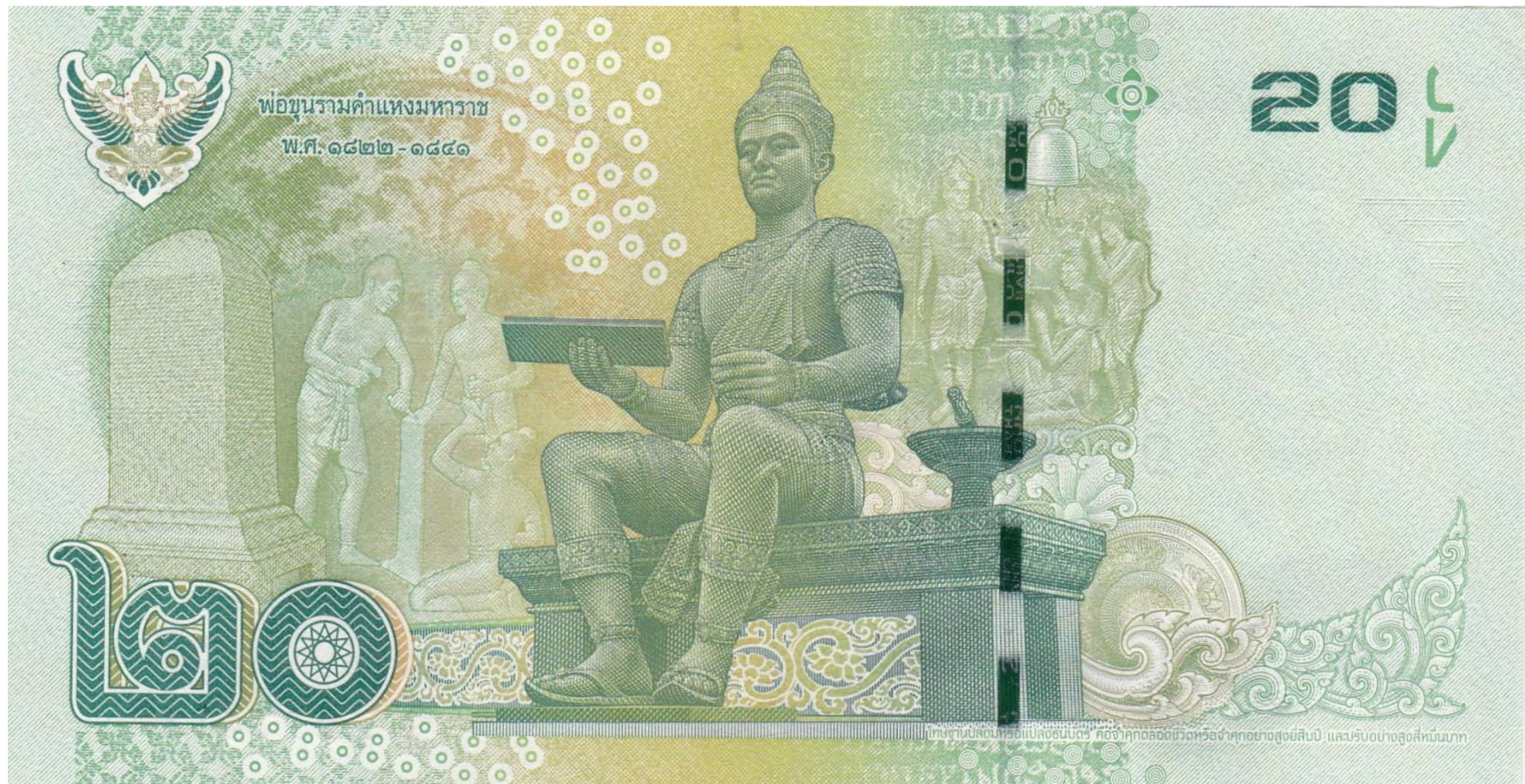
ที่มา: นายปณณวิชญ์ ศรีบุญมี ถ่ายเมื่อวันที่ ๖ ตุลาคม พ.ศ. ๒๕๖๕