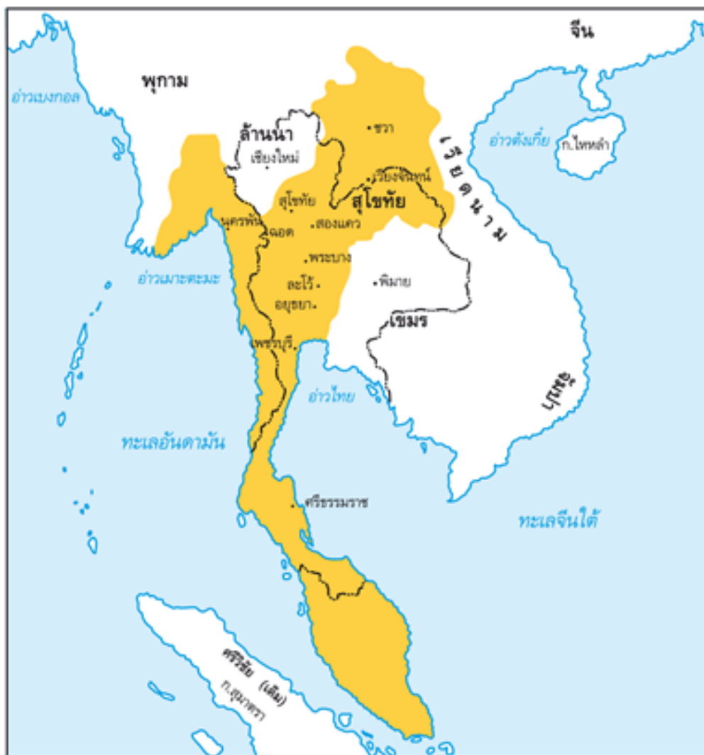
แผนที่แสดงอาณาเขตอาณาจักรสุโขทัยสมัยพ่อขุนรามคำแหงมหาราช