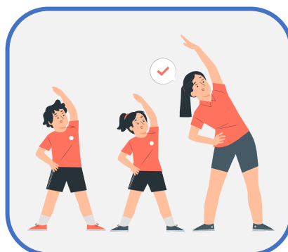
Physical Education P.E