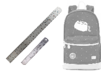
อุปกรณ์การเรียน