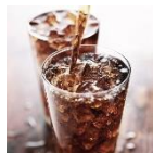
น้ำอัดลม