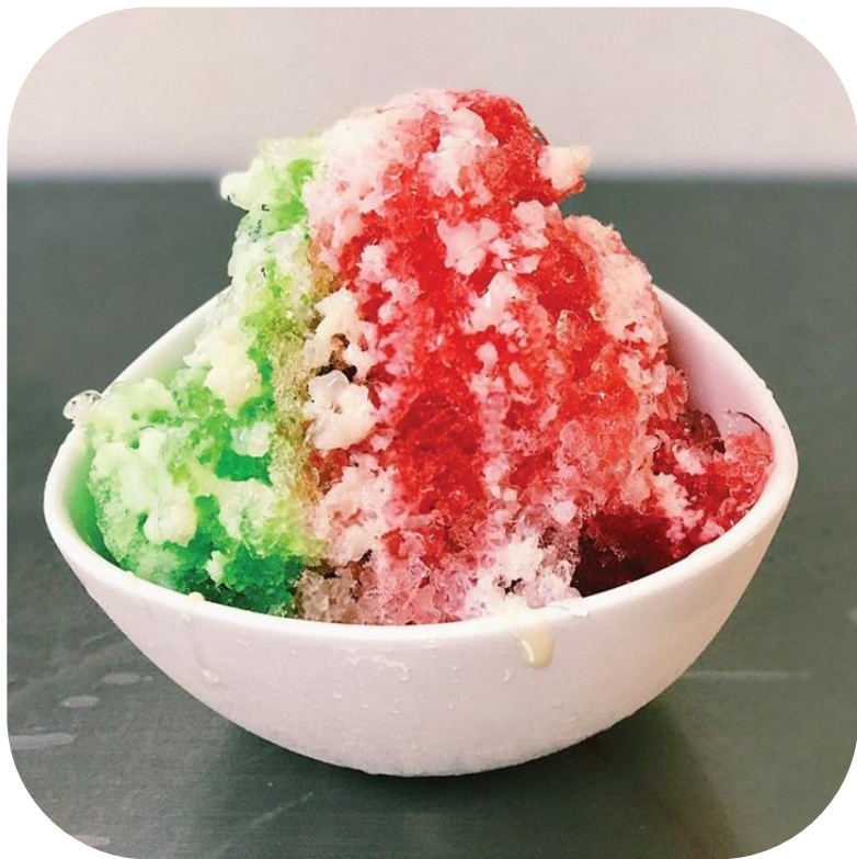
น้ำแข็งไส