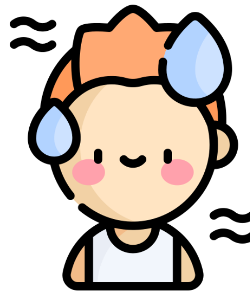
อากาศร้อน