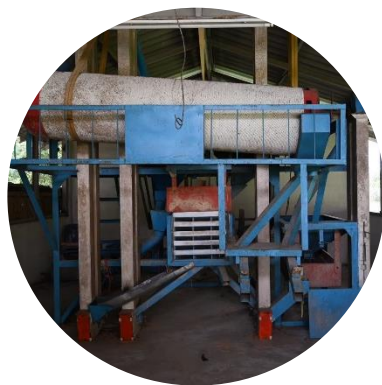
เครื่องสีข้าวขนาดเล็ก

“เมื่อถึงฤดูกาลเก็บเกี่ยวข้าวเปลือกที่เก็บเกี่ยวได้บางส่วนจะถูกนำไปขายให้แก่โรงสี แต่ข้าวเปลือกอีกส่วนหนึ่งเกษตรกรจะนำไปสีด้วยเครื่องสีข้าวขนาดเล็ก เพื่อนำข้าวเหล่านั้นมาจัดจำหน่ายรวมถึงนำไปบริโภคในครัวเรือน โดยเมื่อใส่ข้าวเปลือกลงในเครื่องสีข้าว เครื่องจะทำการโม่และร่อนข้าวจนได้ข้าวสารที่แยกส่วนออกมาจากข้าวเปลือก วันหนึ่งเครื่องสีข้าวเสีย เกษตรกรมือใหม่จึงต้องกลับมาใช้เครื่องโม่ข้าว ซึ่งข้าวที่ได้หลังจากการโม่ข้าว เกษตรกรคนนี้ต้องทำอะไรบ้างกับข้าวที่ได้ หลังจากการโม่ข้าว เพื่อทำความสะอาดข้าวเปลือกหรือแยกสิ่งแปลกปลอมขนาดเล็ก เช่น หิน โลหะ และนำสารที่ได้จากการโม่ข้าว เช่น แกลบ รำ ข้าวสาร ซึ่งมีลักษณะดังรูป ไปใช้ประโยชน์