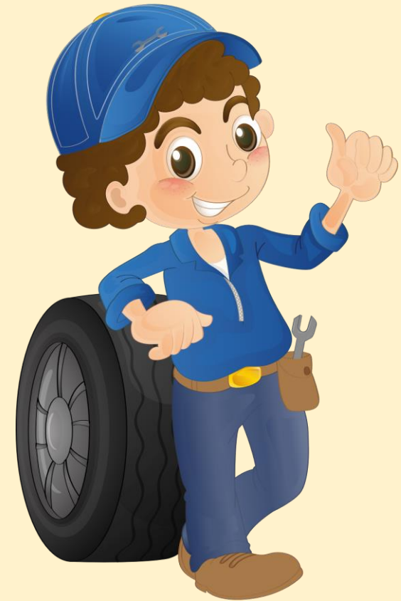
ช่างซ่อมรถ