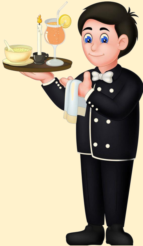
พนักงาน เสิร์ฟอาหาร