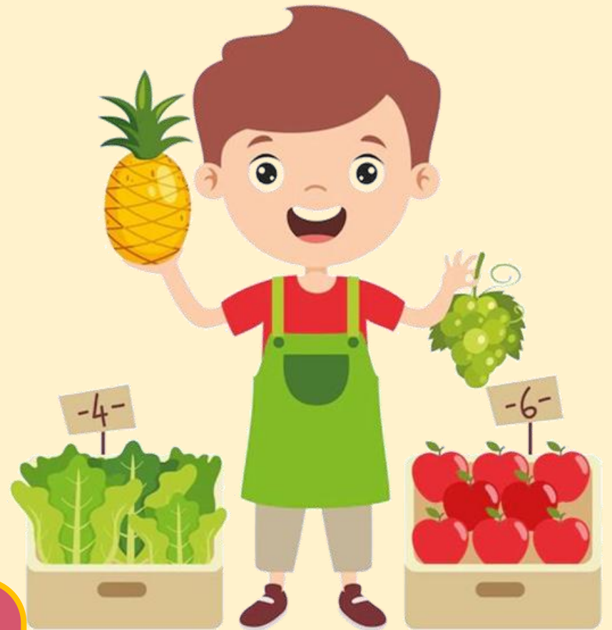
ขายผลไม้