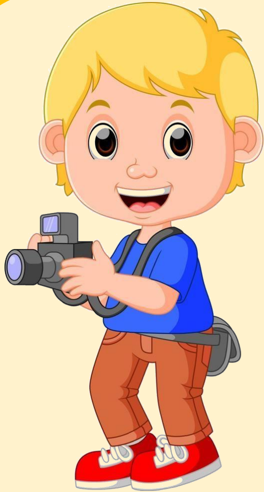
ช่างถ่ายรูป