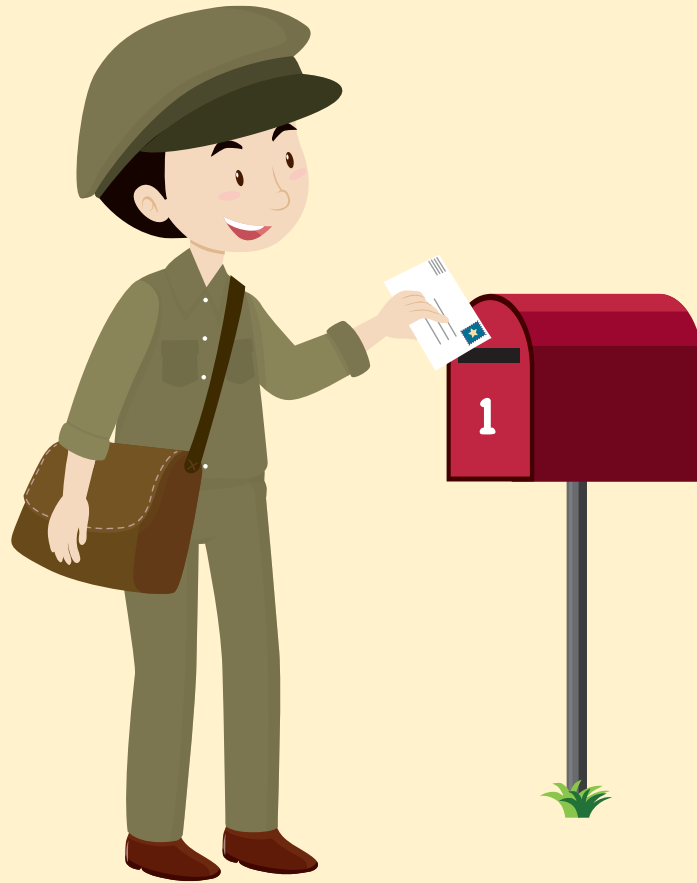
บุรุษไปรษณีย์