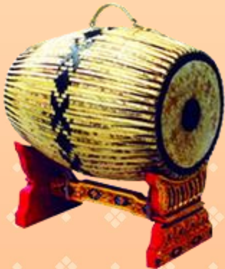
ตะโพนไทย