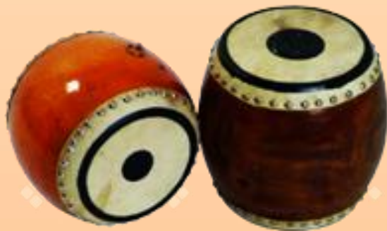
กลองชาตรี