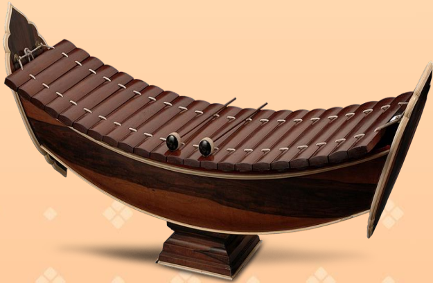
ระนาดเอก