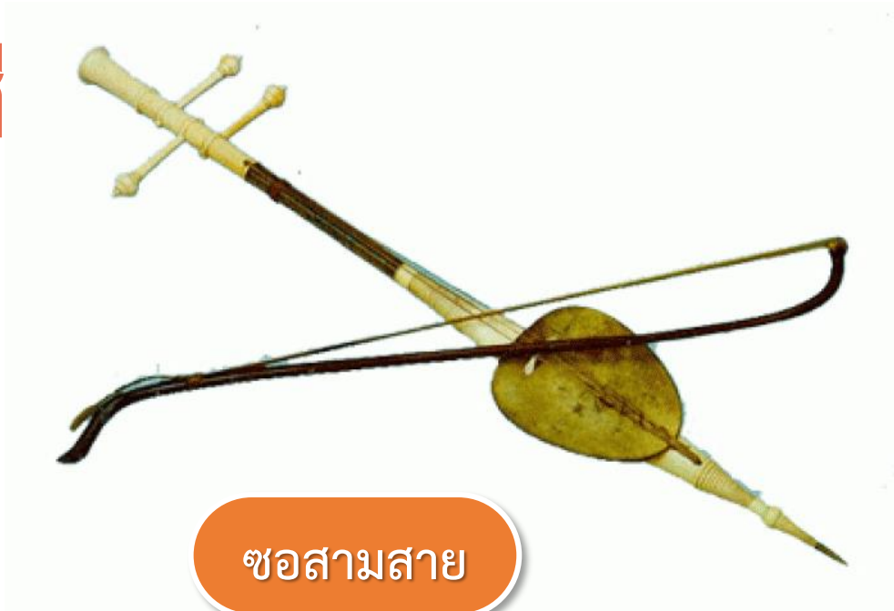
ซอสามสาย