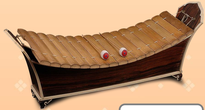
ระนาดทุ้ม