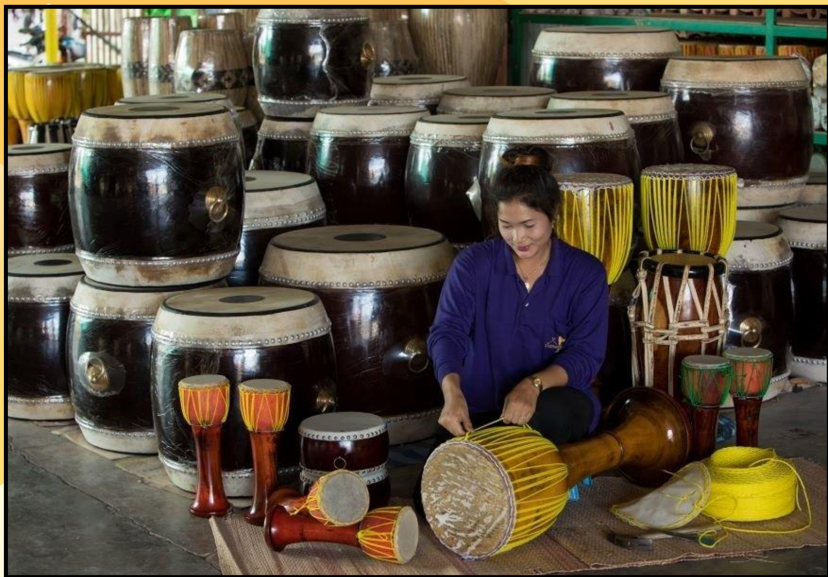
หมู่บ้านทำกลอง ต.เอกราช อ.ป่าโมก จ.อ่างทอง