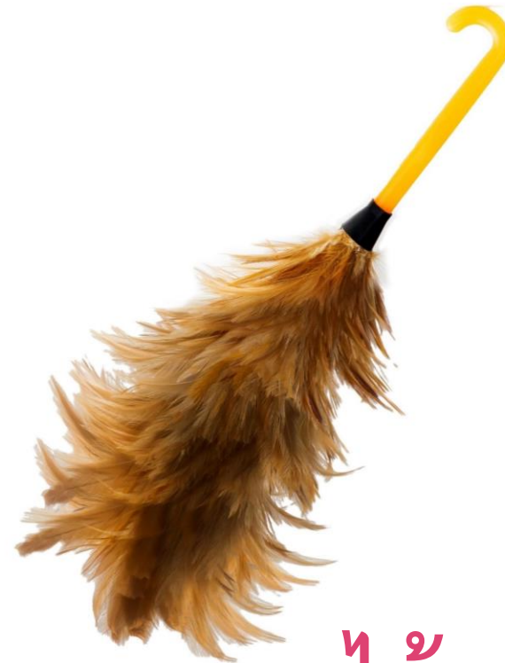
ไม้กวาดขนไก่