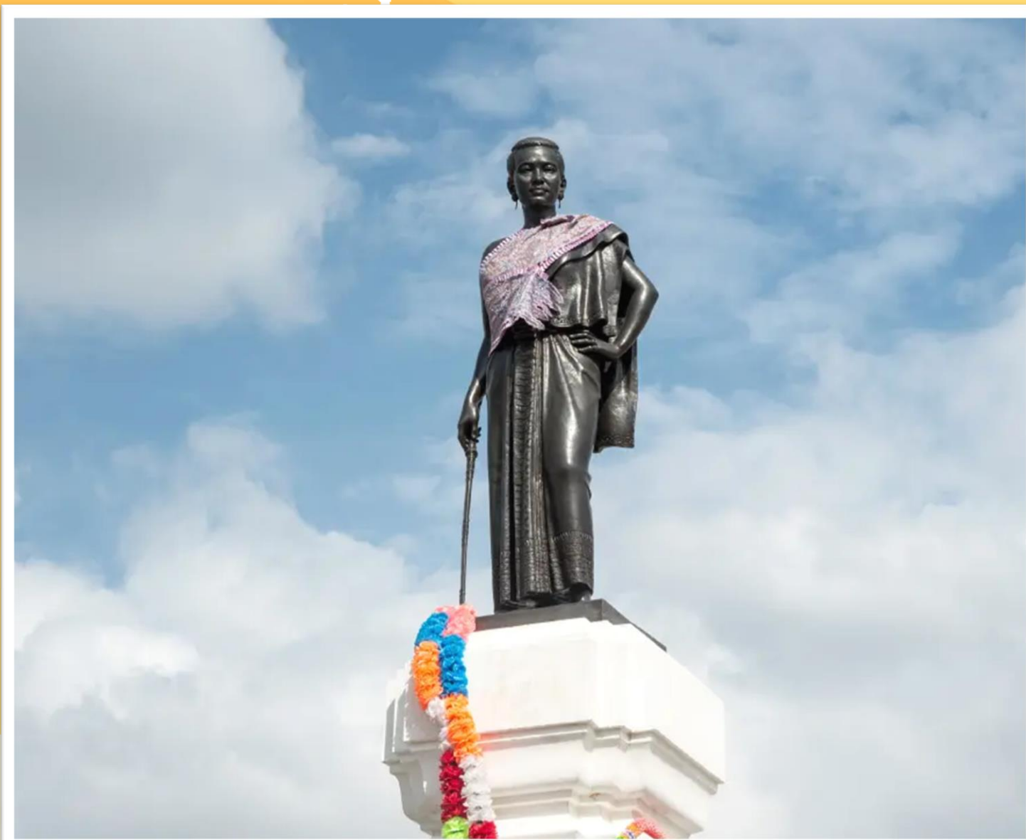
อนุสาวรีย์ย่าโม