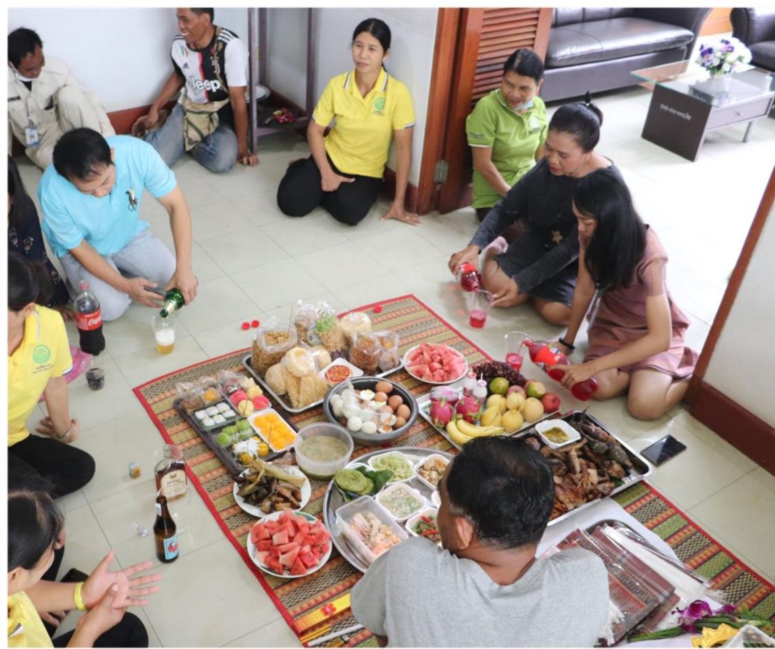
ประเพณีแซนโถงนตา