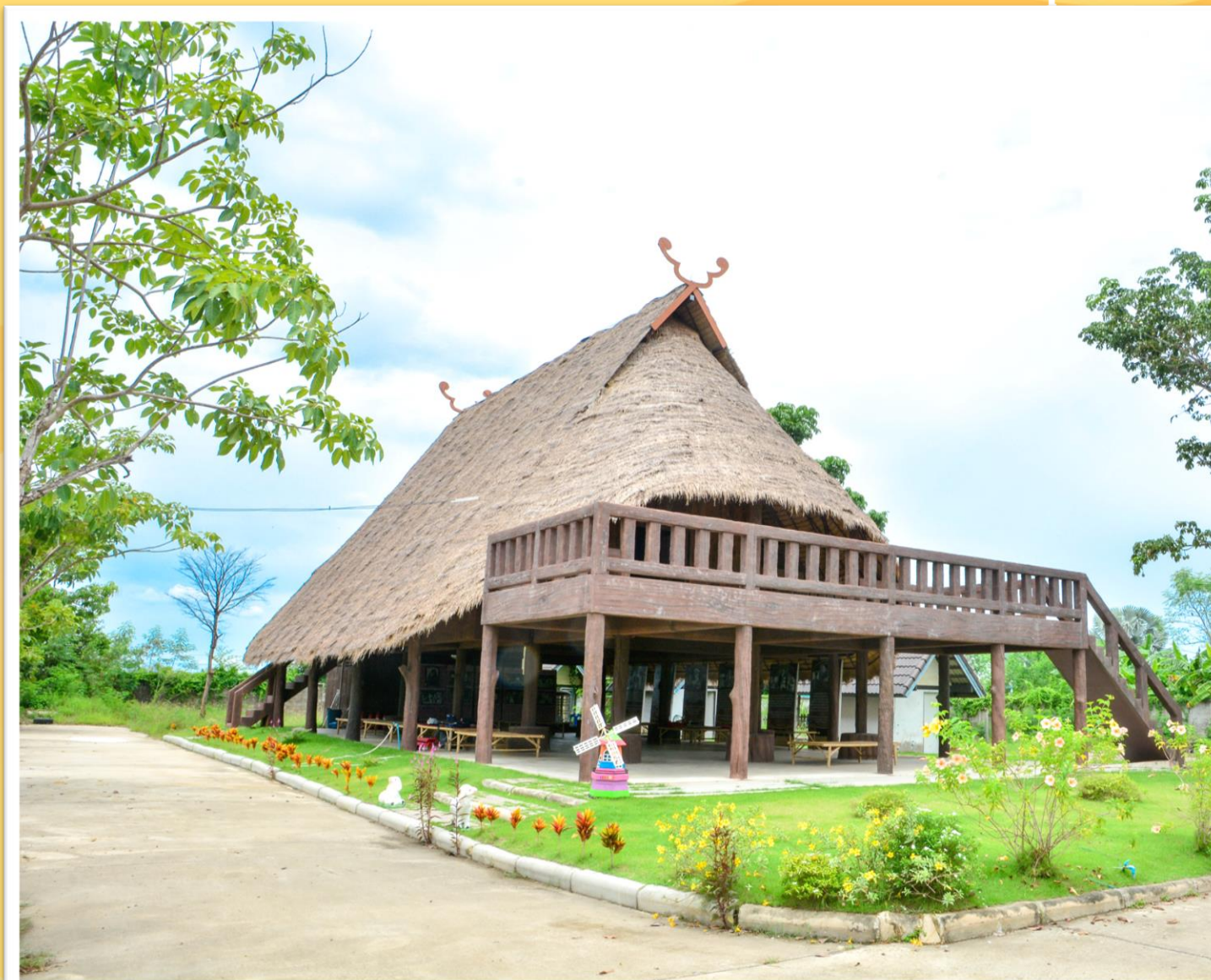
บ้านไทยทรงดำ