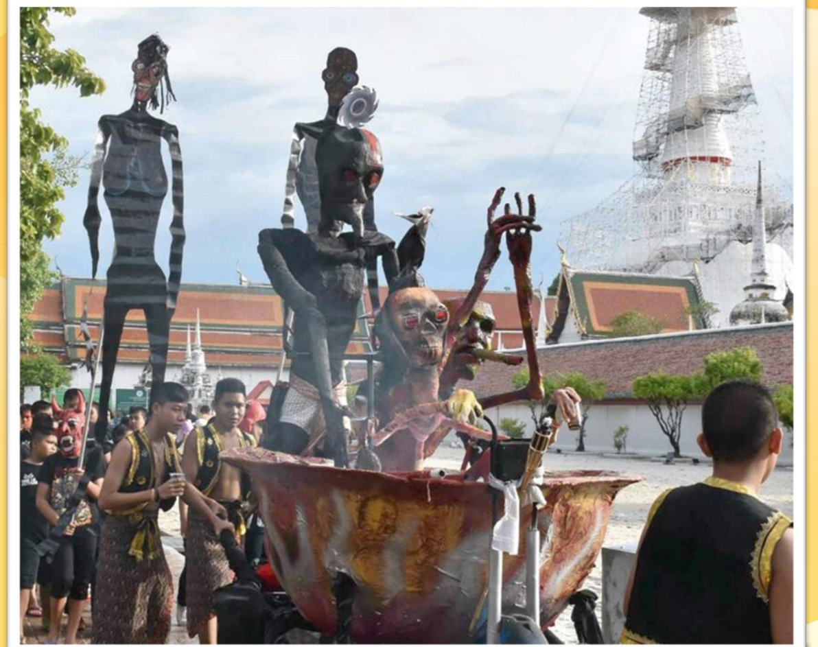
ประเพณีชิงเปรต