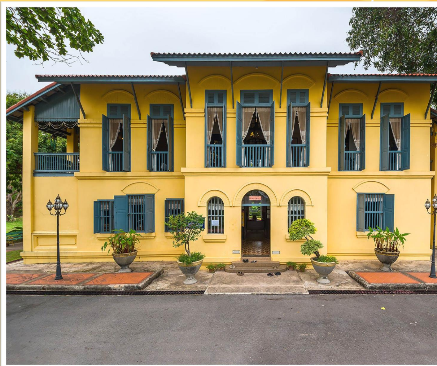
ตึกเก่า จ.นครพนม