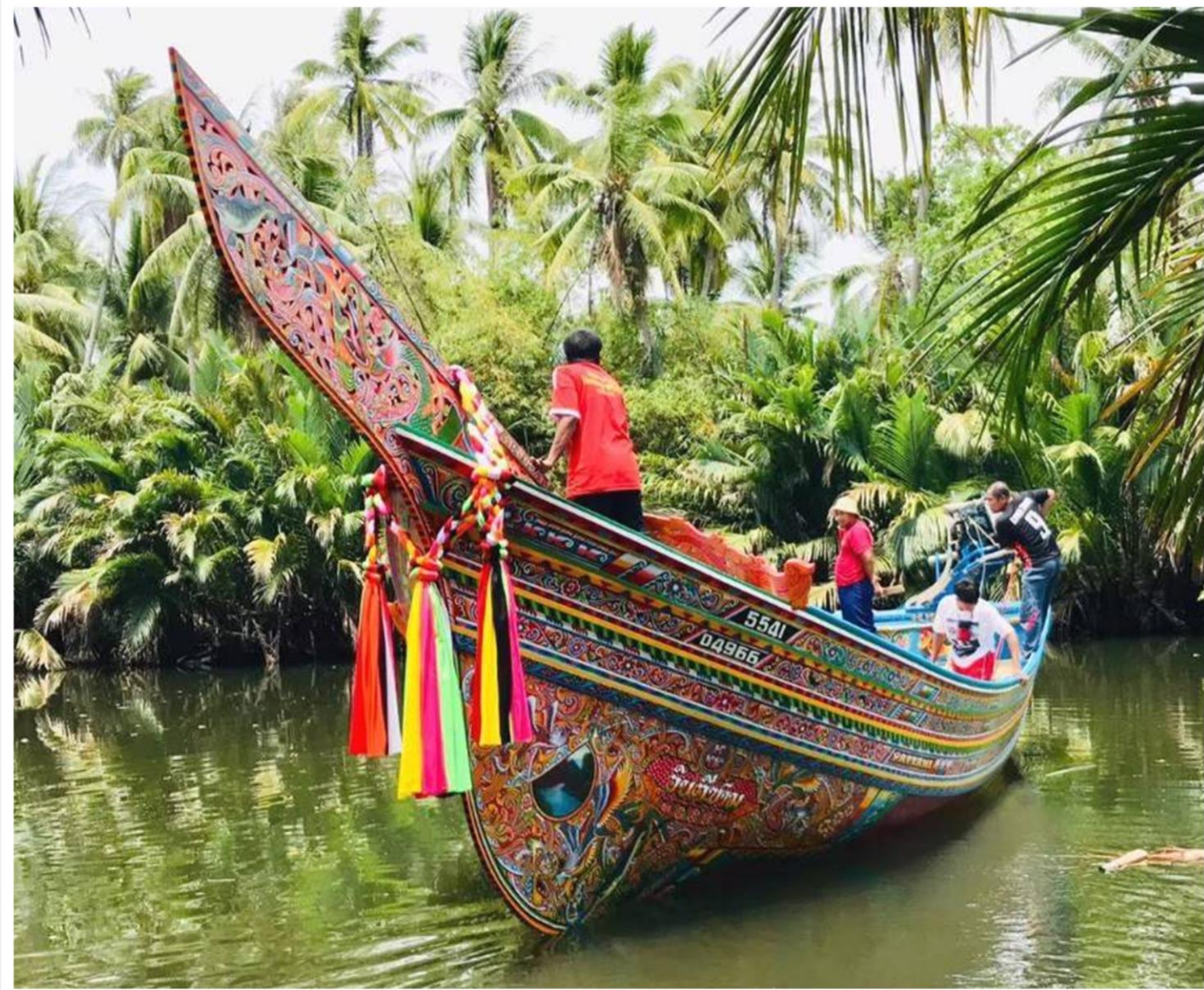
เรือกอละ