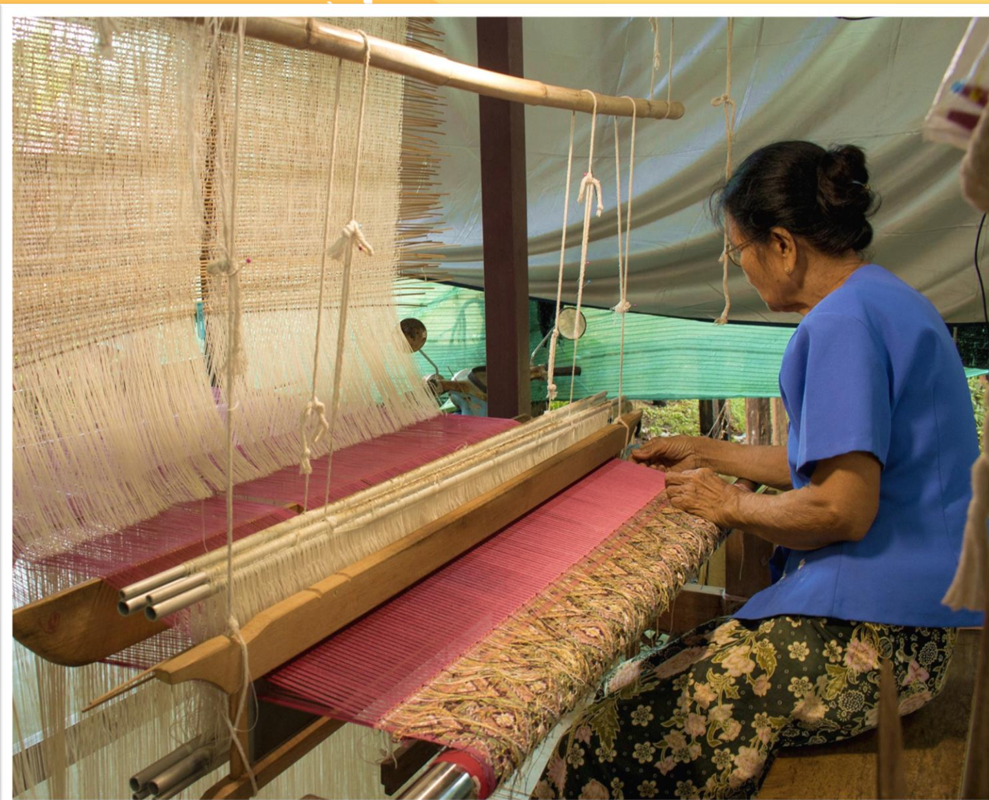
การทอผ้า