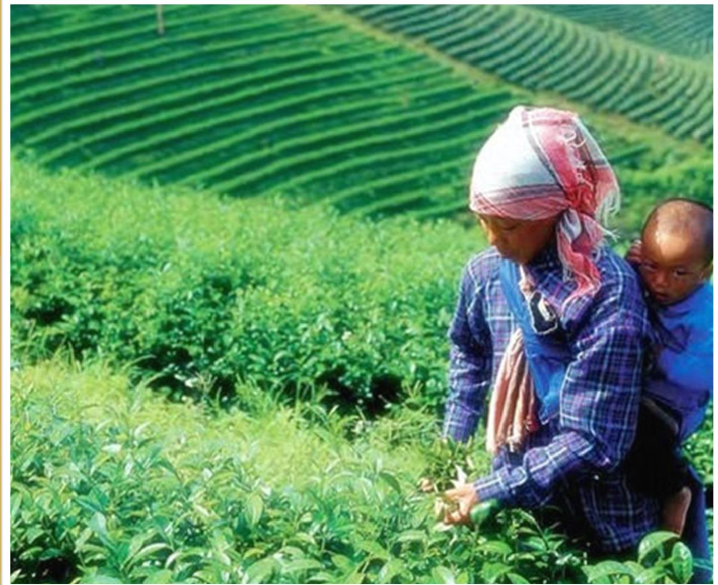
การปลูกชา ภาคเหนือ