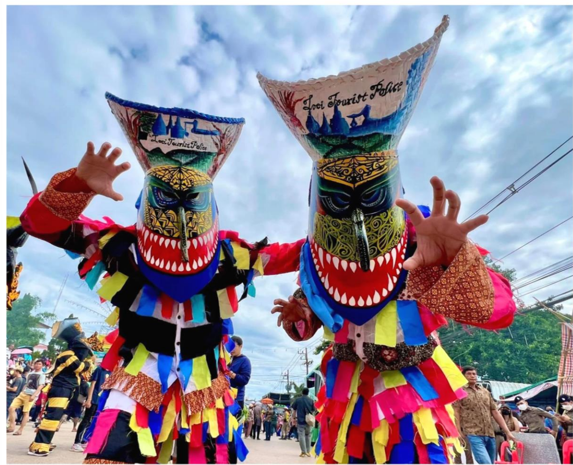
ประเพณีผีตาโขน