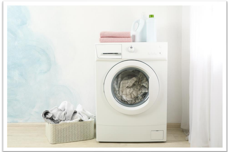
๒. การซักเสื้อผ้าด้วยเครื่องซักผ้า