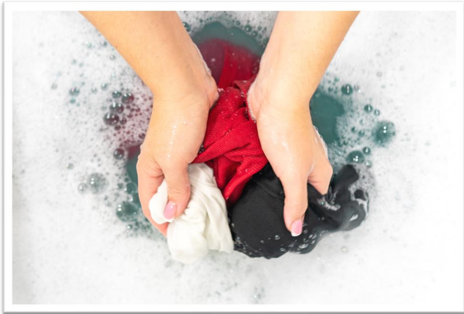
๑. การซักเสื้อผ้าด้วยมือ