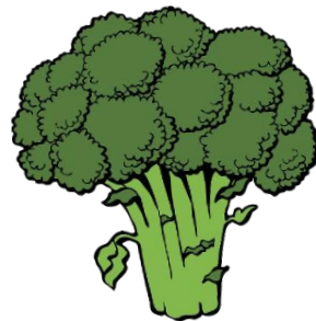
ผักใบเขียว