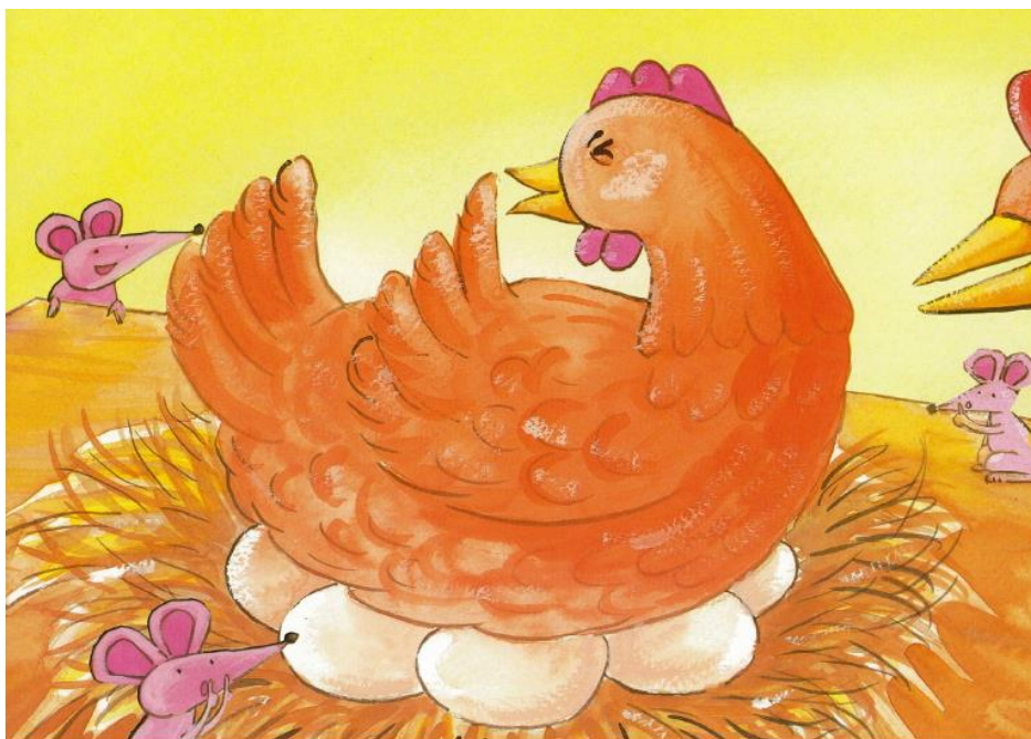
ขอขอบคุณ หนังสือชุดร้องเต้นเล่นอ่านสรรคสร้างจินตนาการสู่ภาษาชุดที่ ๑ เรื่อง "ไก่ฟักไข่" จากเว็บไซต์ https://resourcecenter.thaihealth.or.th/media-webview/xGjr

คำชี้แจง ให้เขียนบรรยายภาพ ความยาว ๕ บรรทัด พร้อมตั้งชื่อ