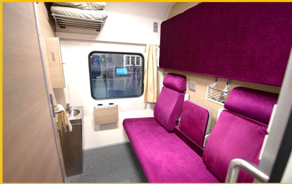
ภายในรถไฟไทยชั้น ๑