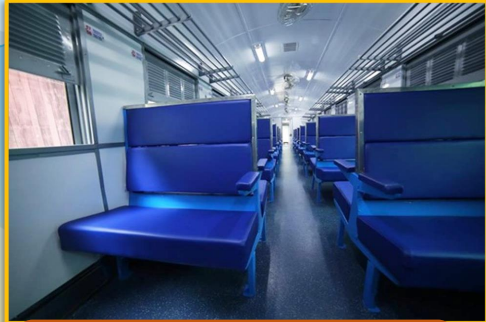
ภายในรถไฟไทยชั้น ๓

ค่าบริการรถไฟไทยชั้น ๑ จะมีราคาแพงกว่ารถไฟไทยชั้น ๓