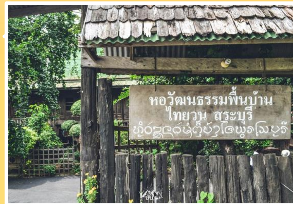
หอวัฒนธรรม