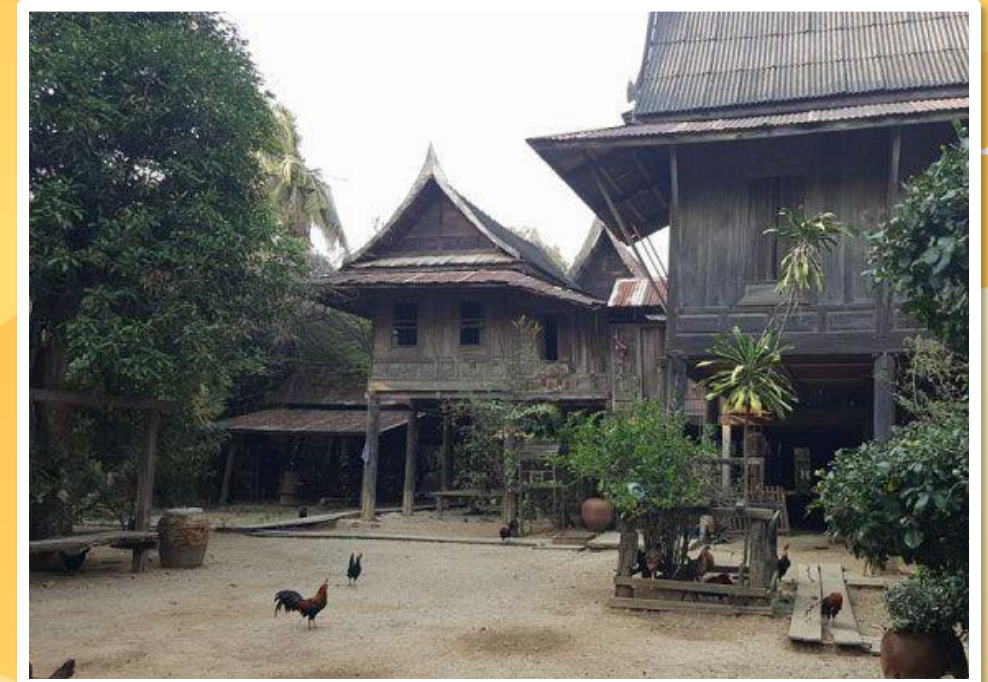
บ้านเรือน