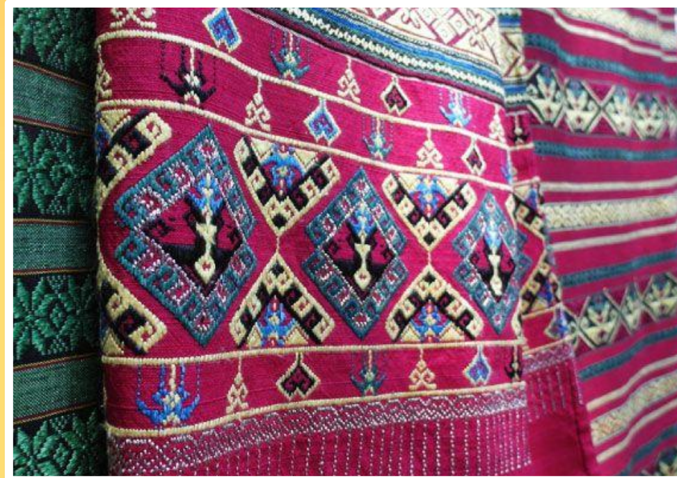
ผ้าทอโบราณ