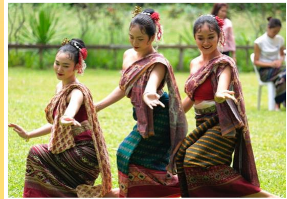
การแสดงวัฒนธรรม