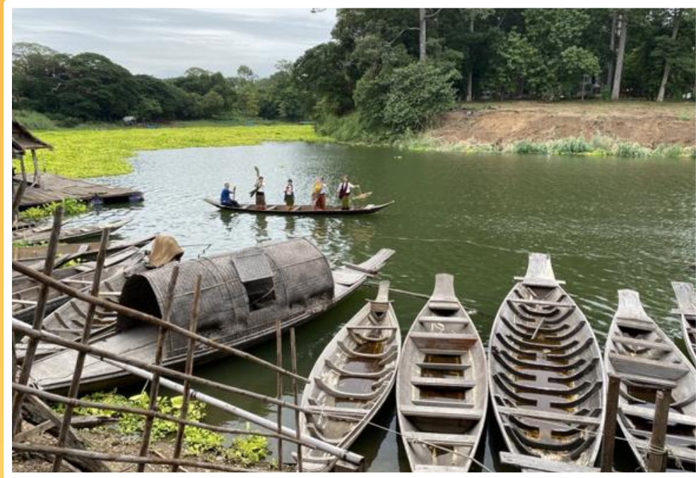
เรือโบราณ