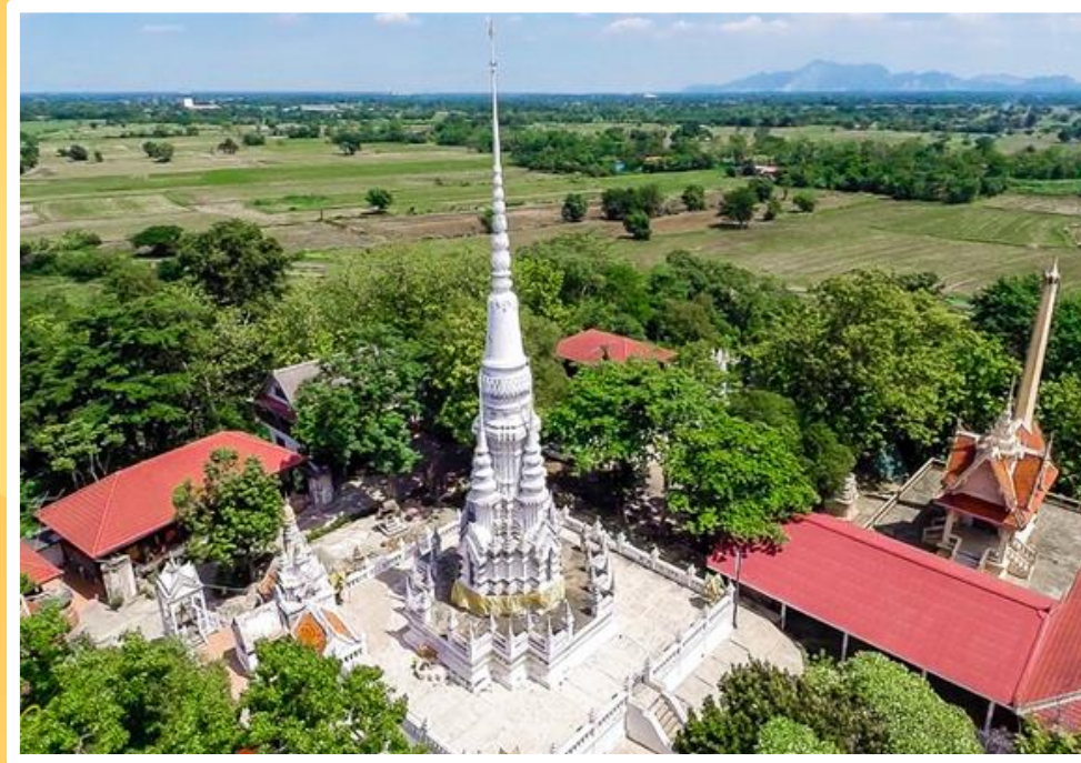
วัดเขาแก้วรวิหาร