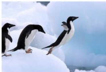
ภาพเพนกวินขณะกำลังออกตัวบิน

แต่ในขณะเดียวกันก็มีข่าวดี ในการสำรวจครั้งนี้พบว่าสายพันธุ์โกลเด้น รีทริฟเวอร์ เดอ เพนกวิน (Golden Retriever de Penquin) มีจำนวนประชากรเพิ่มขึ้น เนื่องจากความร้อนที่สูงผิดปกติก่อให้เกิดการวิวัฒนาการทางร่างกายอย่างก้าวกระโดด นำไปสู่การที่เพนกวินสายพันธุ์นี้บินได้!