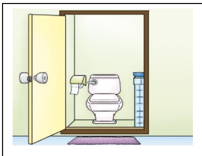
วิธีการทำความสะอาดห้องส้วม