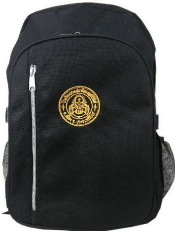
กระเป๋าของนักเรียนคนที่ 1