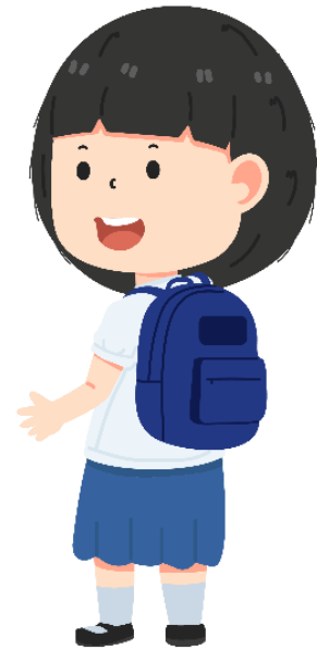
นักเรียนคนที่ 3