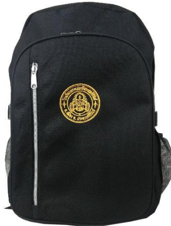
กระเป๋าของนักเรียนคนที่ 2