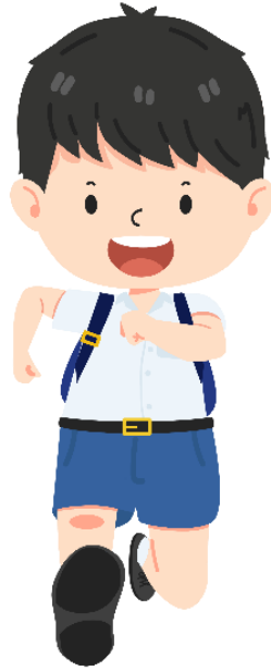
นักเรียนคนที่ 2