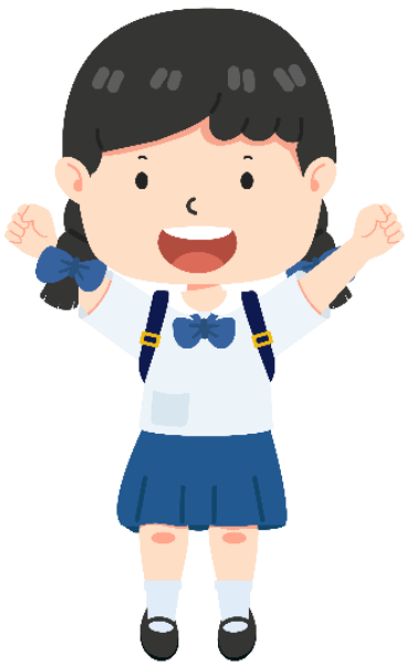
นักเรียนคนที่ 1

2. สถานการณ์ : นักเรียน 3 คนหยิบกระเป๋าไปที่ใส่หนังสือมาโรงเรียน สลับกัน กลับบ้านไป โดยทราบว่า กระเป๋าเป้ของนักเรียนคนที่ 3 ไม่ได้อยู่ที่นักเรียนคนที่ 2 อยากให้ช่วยหาว่ากระเป๋าเป้ของใครอยู่กับนักเรียนคนใด