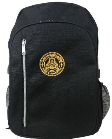
กระเป๋าของนักเรียนคนที่ 3