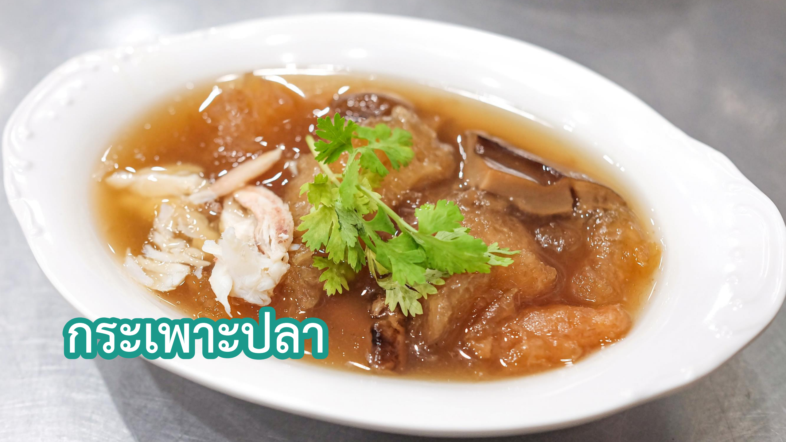
กระเพาะปลา