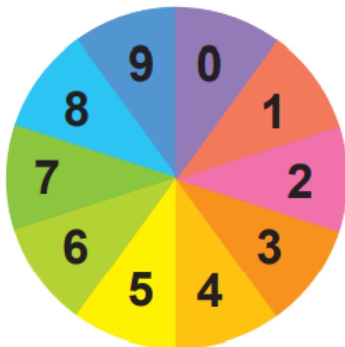
วงล้อตัวเลข