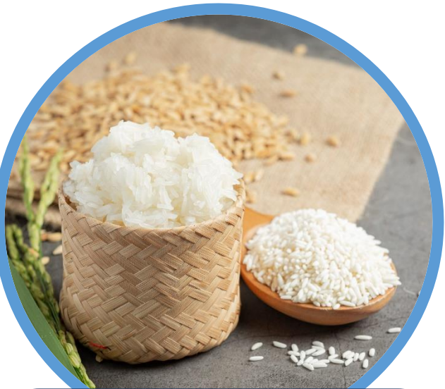
ข้าวเหนียว