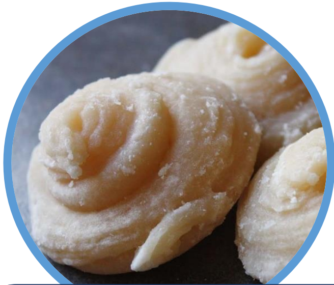
น้ำตาลมะพร้าว