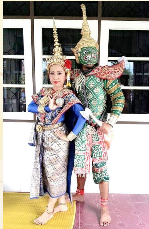
รำเมขลา รามสูร