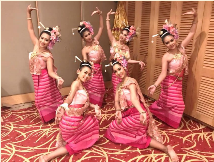
ฟ้อนสาวไหม