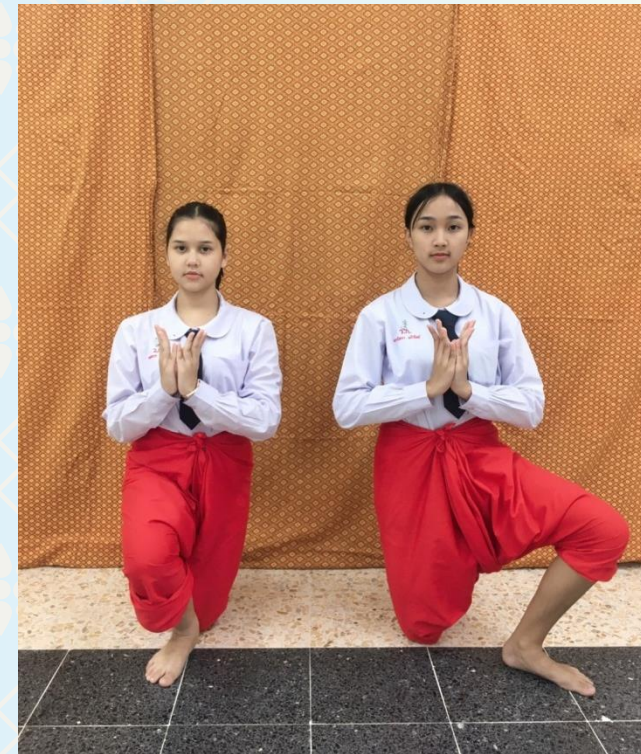
ท่าดอกบัว

นักเรียนร่วมกันสังเกตและแสดงความคิดเห็นว่า ภาษาท่า หรือ ท่ารำ ที่มาจากการประดิษฐ์ มีความคล้ายคลึงกันอย่างไร