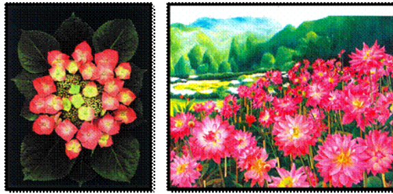
ภาพสีสันดอกไม้ในธรรมชาติ ภาพทัศนศิลป์