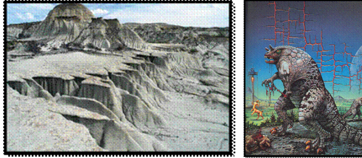
ลักษณะผิวในธรรมชาติและลักษณะผิวในงานทัศนศิลป์