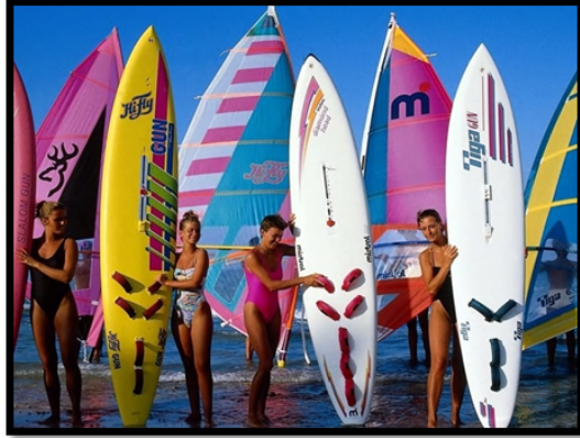
รูปทรงหรือวัตถุ มีลักษณะเป็น ๓ มิติ

รูปร่างและรูปทรงเป็นส่วนประกอบที่เกิดจากการนำเส้นมาประกอบเป็นรูปภาพ ดังนั้น การฝึกใช้เส้นที่ชำนาญและแม่นยำจะนำมาสู่การเขียนภาพ รูปร่างรูปทรงได้ดี การสังเกตรูปร่างหรือเส้นรอบนอกของวัตถุสิ่งของ จะช่วยให้เราเห็นภาพที่จะวาดได้ชัดเจน และช่วยให้ร่างภาพได้ชัดเจน