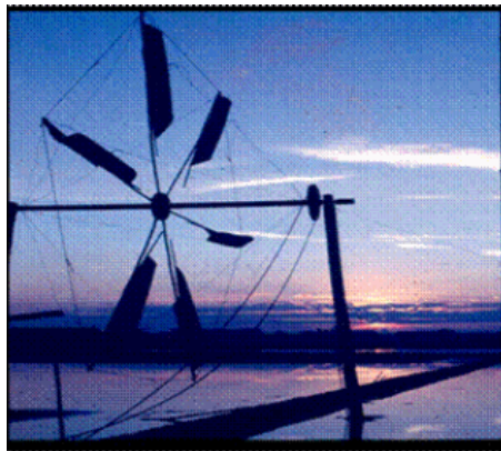
สีลาของเส้นในธรรมชาติและสิ่งแวดล้อม

เนื่องจากเส้นให้ความรู้สึกต่ออารมณ์จิตใจของมนุษย์ เราจึงสามารถนำเส้นมาสร้างสรรค์เป็นงานศิลปะที่ให้คุณค่าทางความงามและอารมณ์ความรู้สึกได้โดยง่าย