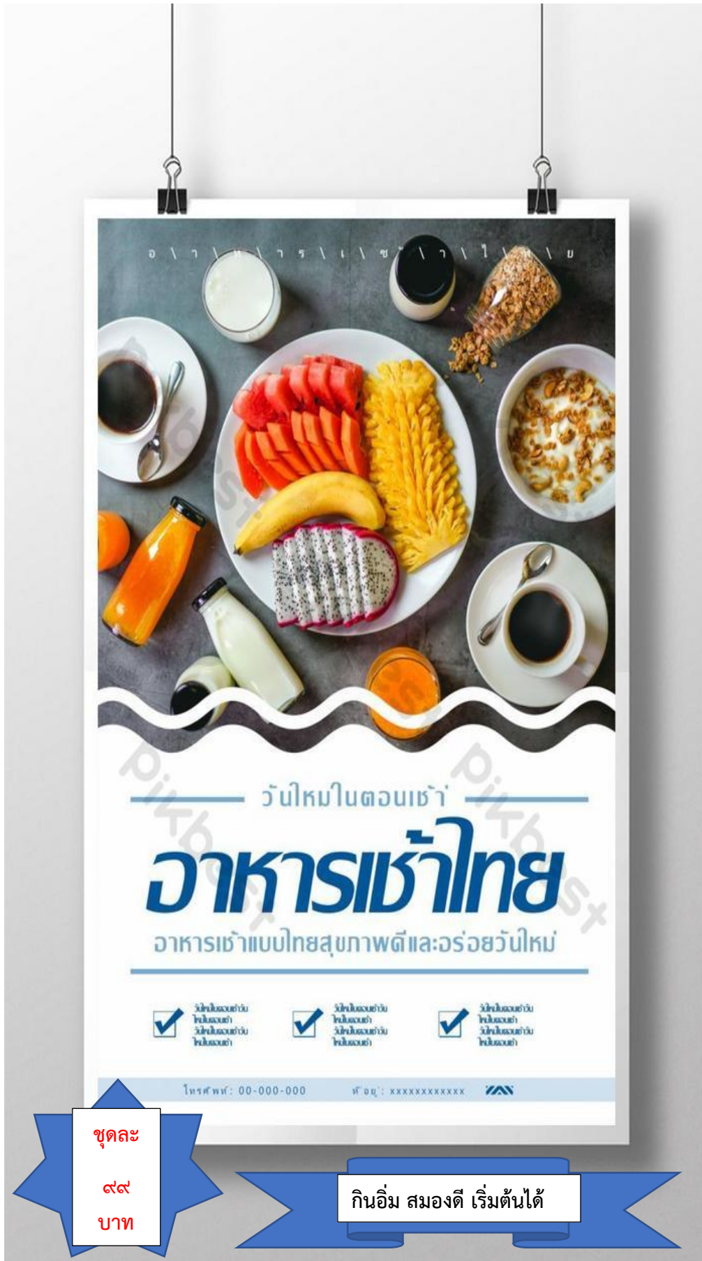
ตัวอย่างชิ้นงานโรลอัพ (Roll up)