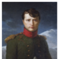
หลุยส์ เลอโบล

ในคริสต์ศตวรรษที่ ๑๙ ประเทศตะวันตกได้ขยายลัทธิจักรวรรดินิยมอย่างกว้างขวาง โดยเฉพาะในเอเชียและแอฟริกา เป็นที่น่าสังเกตว่านอกจากอังกฤษและฝรั่งเศสยึดครองดินแดนอาณานิคมมากที่สุดแล้วประเทศที่มีบทบาทขยายอำนาจในขณะนั้นต่างต้องการพัฒนาเป็นจักรวรรดิที่มีใหญ่ จึงขยายลัทธิจักรวรรดินิยมเพื่อสร้างฐานอำนาจทางเศรษฐกิจและการเมืองที่มั่นคง