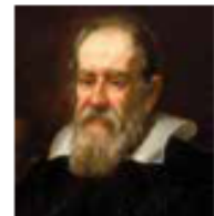
กาลิเลโอ กาลิเลอี

๑) นีโคลัส โคเปอร์นิคัส (Nicholas Copernicus) ชาวโปแลนด์ เสนอทฤษฎีว่าดวงอาทิตย์เป็นศูนย์กลางของจักรวาล โดยมีดาวเคราะห์รวมทั้งโลกหมุนรอบดวงอาทิตย์ ทฤษฎีของเขาตั้งคำถามเชื่อของคนในสมัยโบราณและสมัยกลางที่มีคติเชื่อสมมติฐานของอริสโตเติล (Aristotle) และงานเขียนของปโตเลมี (Ptolemy) ที่อธิบายว่า โลกเป็นศูนย์กลางของจักรวาล