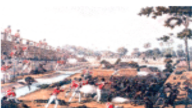
กองทัพอังกฤษเข้าโจมตีเมือง คือ นำชาวต่างชาติเข้ามาเป็นผู้ปกครองแทนชาวพื้นเมืองและ

วิธีการที่ชาติตะวันตกใช้ในการแสวงหาอาณานิคมนั้นโดยมากมักจะใช้วิธีการใช้กำลังทางทหารซึ่งมีแสนยานุภาพที่เหนือกว่ากองทัพพื้นเมืองในการแทรกแซงและบังคับผู้ปกครองชาวพื้นเมืองให้ยกดินแดนหรือให้สิทธิประโยชน์ทางด้านเศรษฐกิจให้กับชาตินิยมชาตินิยม เช่น ความขัดแย้งระหว่างฝรั่งเศสกับสยามจนเป็นเหตุให้ฝรั่งเศสสถาปนาเวียดนามเข้ามามีอำนาจใหม่ในภูมิภาคการันต์ ๑๙๒๒ และทำให้สยามต้องยกดินแดนในอินโดจีนให้กับฝรั่งเศส การนำกองทัพเข้าแทรกแซงผ่านกระบวนการทั้งหมักหมมเป็นอาณานิคมของอังกฤษ เป็นต้น