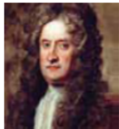
เซอร์ไอแซก นิวตัน

๕) เซอร์ไอแซก นิวตัน (Sir Isaac Newton) เป็นนักวิทยาศาสตร์ชาวอังกฤษซึ่งค้นพบแรงโน้มถ่วงของโลก และให้ข้อสรุปเกี่ยวกับการโคจรและ การเคลื่อนไหวในระบอบฮิโวลิตกรกล่าวว่าเป็นไปตามกฎแห่งความโน้มถ่วง (Law of Gravitation)