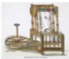
เครื่องจักรไอน้ำ

การพัฒนาของอุตสาหกรรมประเภทอื่น การประดิษฐ์เครื่องจักรไอน้ำและเครื่องจักรประเภทอื่นที่เกิดขึ้นตามมา ทำให้มีความต้องการใช้แร่เหล็ก จึงเป็นวัสดุสำคัญในการสร้างเครื่องจักรกลเพิ่มขึ้น ส่งผลให้เกิดอุตสาหกรรมเหมืองแร่ และอุตสาหกรรมถ่านหินซึ่งเป็นพลังงานที่ใช้กันแพร่หลายใน