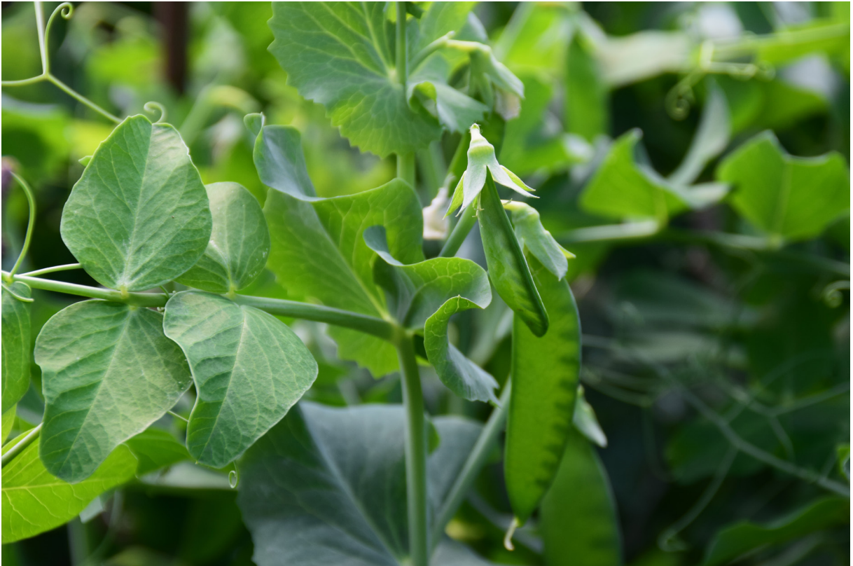
ภาพพืชชนิดหนึ่ง