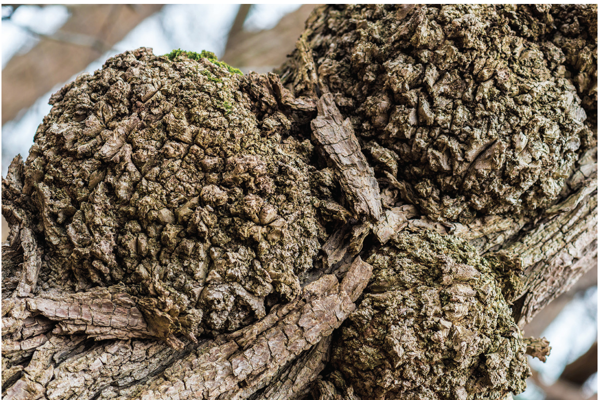
ภาพที่ 1 ปุ่มปมบนต้นไม้ที่เกิดจากแบคทีเรีย Agrobacterium tumefaciens

กระบวนการเปลี่ยนแปลงพันธุกรรมของสิ่งมีชีวิตสามารถเกิดขึ้นได้เองตามธรรมชาติโดยอาจมีการเพิ่มขึ้นหรือลดลงของสารพันธุกรรมในเซลล์ของสิ่งมีชีวิตชนิดนั้น เช่น การเปลี่ยนแปลงจำนวนโครโมโซมเนื่องจากเกิดความผิดปกติในการแบ่งเซลล์ และการได้รับยีนจากสิ่งมีชีวิตชนิดอื่น ตัวอย่างเช่น พืชใบเลี้ยงคู่ที่มีบาดแผลเมื่อได้รับยีนจากแบคทีเรียที่มีชื่อว่า Agrobacterium tumefaciens จะทำให้เซลล์พืชบริเวณนั้นเกิดการแบ่งเซลล์เพิ่มขึ้นเป็นจำนวนมากจนเกิดปุ่มปมซึ่งเป็นที่อยู่อาศัยของแบคทีเรีย ดังภาพที่ 1 มนุษย์ได้เลียนแบบกระบวนการเปลี่ยนแปลงพันธุกรรมของสิ่งมีชีวิตในธรรมชาตินี้ เพื่อประยุกต์ใช้ให้เกิดประโยชน์ตามต้องการ เรียกกระบวนการดัดแปรพันธุกรรมของสิ่งมีชีวิตโดยมนุษย์นี้ว่า พันธุวิศวกรรม (genetic engineering)