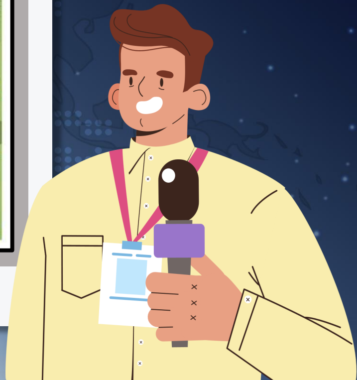
ที่มาภาพ หนังสือพิมพ์กรุงเทพธุรกิจ ฉบับวันที่ ๑๒ ตุลาคม ๒๕๖๓