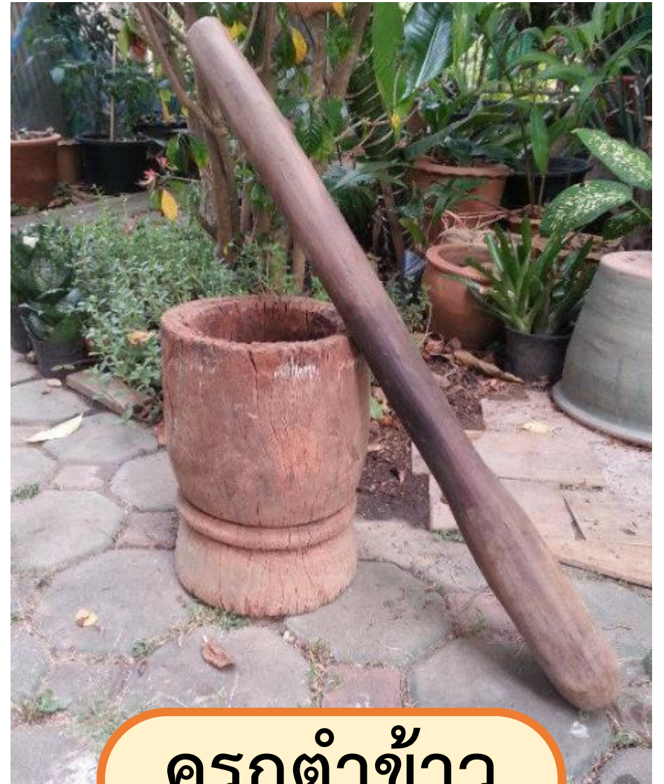
ครกตำข้าว

https://www.kaidee.com/product-346389609