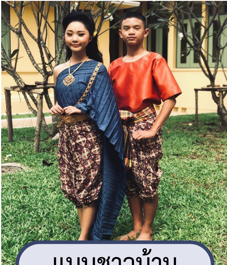
แบบชาวบ้าน