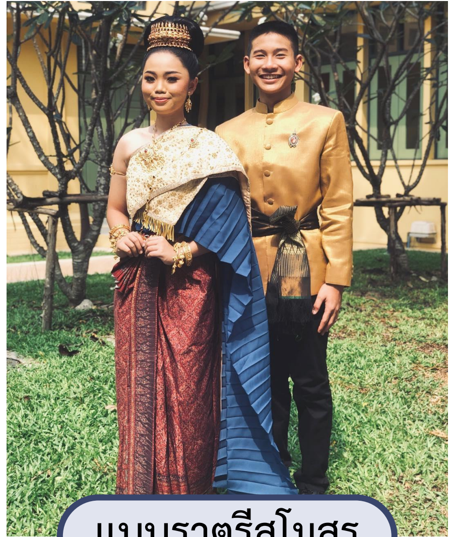
แบบราตรีสโมสร