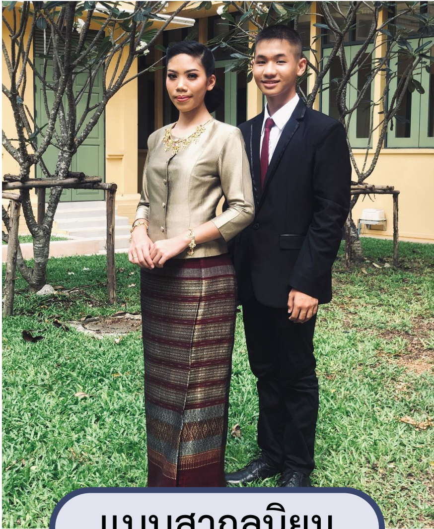
แบบสากลนิยม