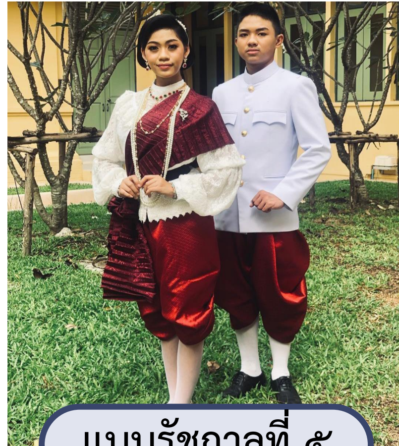
แบบรัชกาลที่ ๕