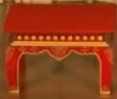
ศูนย์สังคีตศิลป์ ธนาคารกรุงเทพ