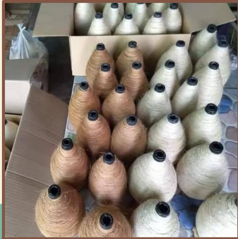
ด้ายสับปรดพร้อมทอ