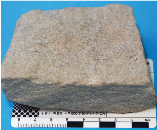
ภาพที่ 2 หินทราย