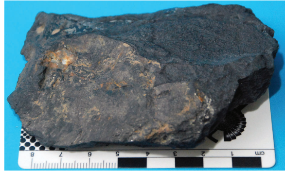
ภาพที่ 3 หินดินดาน

ชั้นหินอุ้มน้ำจะมีชั้นหินที่มีเนื้อละเอียดแน่นรองรับไว้ซึ่งเป็นชั้นหินหรือชั้นตะกอนที่มีสมบัติไม่ยอมให้น้ำไหลซึมผ่านหรือไหลซึมผ่านได้แต่น้อยมาก เนื่องจากมีช่องว่างระหว่างตะกอนเล็กมากหรือมีเนื้อละเอียดแน่น ชั้นหินนี้จึงทำหน้าที่เสมือนเป็นขอบเขตบนหรือขอบเขตล่างของชั้นหินอุ้มน้ำ ตัวอย่างชั้นหินที่มีเนื้อละเอียดแน่น เช่น ชั้นหินดินดาน ตัวอย่างหินดินดาน แสดงดังภาพที่ 3