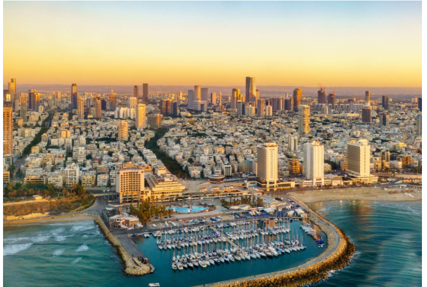
เทลอาวีฟ Tel Aviv อิสราเอล.

เทลอาวีฟ ตั้งขึ้นเมื่อ ค.ศ.๑๙๐๙ บนเขตพื้นที่รอบนอกของเมืองท่าโบราณจัฟฟา เป็นเมืองที่มีเศรษฐกิจ มั่งคั่งที่สุดในอิสราเอล นอกจากนี้ การมีชายหาด ร้านอาหารดีสโก้ และคลับมากมาย จึงได้รับฉายาว่า “เมืองที่ไม่เคยหลับ” และยิ่งถูกขนานนามว่าเป็น “หาดไมอามีแห่งทะเลเมดิเตอร์เรเนียน” อีกด้วย เทลอาวีฟได้รับการขึ้นทะเบียนเป็นมรดกโลกเมื่อ ค.ศ.๒๐๐๓