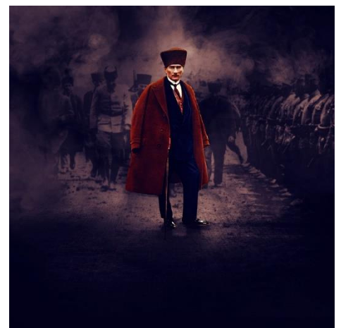
เคมาล อะตาเตอร์ก ผู้ก่อตั้งประเทศตุรกีใน ค.ศ.๑๙๒๓

๑) ดินแดนของอังกฤษ คือ ประเทศจอร์แดน อิรักและอิสราเอล-ปาเลสไตน์ในปัจจุบัน รวมไปถึงรัฐเล็กรัฐน้อยในคาบสมุทรอาระเบีย