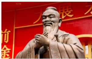
ภาพขงจื้อ

ดำเนินชีวิตในสังคม เช่น ลัทธิขงจื้อ เน้นคำสอนเรื่อง ความกตัญญูต่อบิดา การกราบไหว้บูชาบรรพบุรุษ ส่วนในญี่ปุ่น มีความเชื่อในลัทธิ บูชิโด เรื่องความกล้าหาญและการจงรักภักดีต่อผู้นำ และเริ่มมีการเปลี่ยนแปลงครั้งใหญ่ในคริสต์ศตวรรษที่ ๑๙ เมื่ออิทธิพลตะวันตกในยุคจักรวรรดินิยมแพร่เข้ามา เช่น ญี่ปุ่นสมัยเมจิ ชนชั้นปกครองตั้งแต่จักรพรรดิ เชื่อพระวงศ์ ชุนนาง เป็นผู้นำ ในการรับวิถีแบบตะวันตก ส่วนจีน ชนชั้นปกครองส่วนใหญ่มีก็จะ มีความคิดอนุรักษ์นิยมมากกว่า