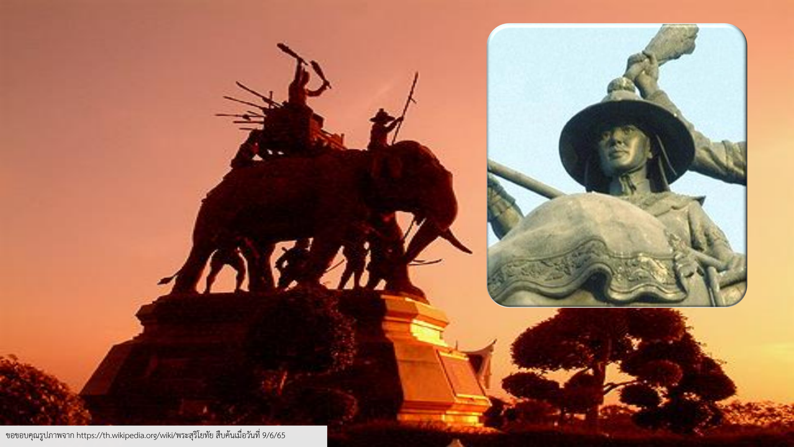
ขอขอบคุณรูปภาพจาก https://th.wikipedia.org/wiki/พระสุริโยทัย สืบค้นเมื่อวันที่ 9/6/65