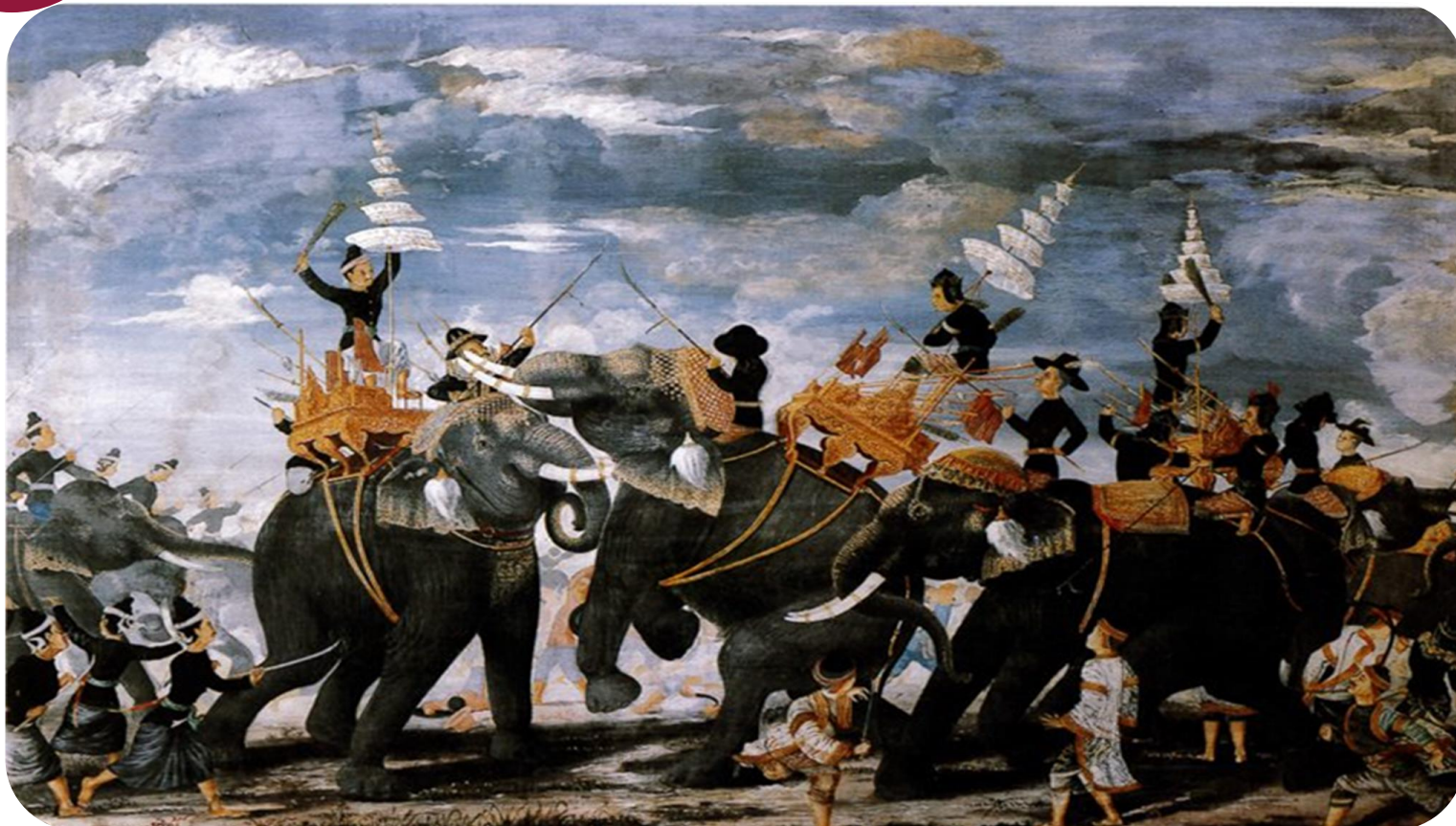
ภาพพระสุริโยทัยขาดคอช้าง